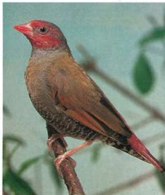
Tekst: E.Siberie