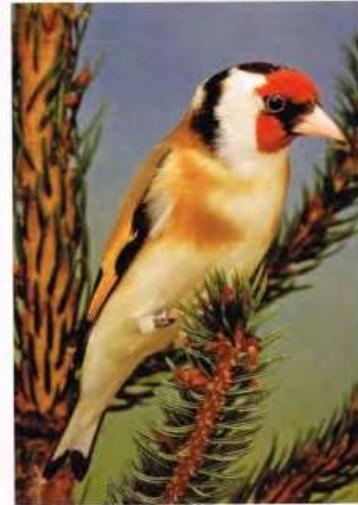
Grote putter – Carduelis c. major

Wilt u de putter in de volière of in een ruime kweekkooi houden dan is het van essentieel belang dat het verblijf een kurkdroge bodem heeft. In een vochtige omgeving kwijnt de putter gewoon weg. Meestal is coccidiosis in dit geval de doodsoorzaak. Voor putters gaat er niets boven een volière die met het zicht naar het zuidoosten staat, zodat de putter kan genieten van rechtstreekse zonnestralen. Niet iedereen heeft die kans en ze kunnen ook wel binnen gehouden worden. Het is toch nodig om er voor te zorgen, dat ze voldoende licht hebben. Putters houden