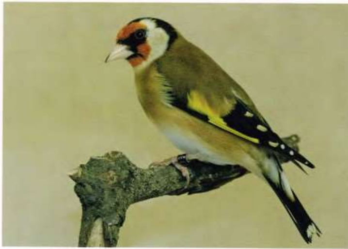
Bloemputter - Carduelis c. carduelis