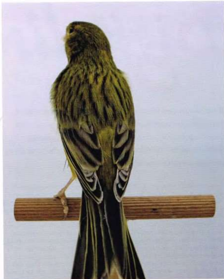
Een agaat geel waarvan de staart te breed is en de vleugels niet sluiten en hierdoor het stuitkassen zichtbaar wordt, dit is een vaak voorkomende fout en wordt veroorzaakt doordat de grote vleugelpennen te smal zijn en hierdoor a.h.w. op elkaar liggen in plaats van als dakpannen over elkaar.

Licht als een veertje – elkaar in de veren zitten – pronken met andermans veren – een veer laten - iemand achter de veren zitten. – een veer op de hoed steken – vroeg uit de veren zijn en ..... men kent de vogels aan hun veren! <