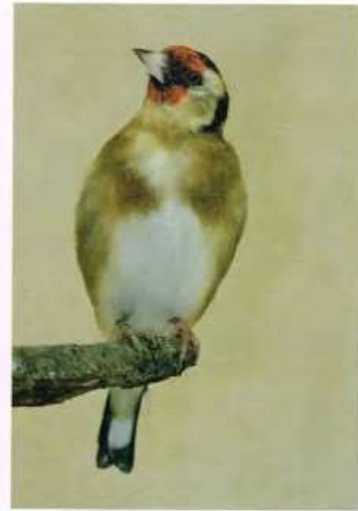
Elzenputter - Carduelis britannica