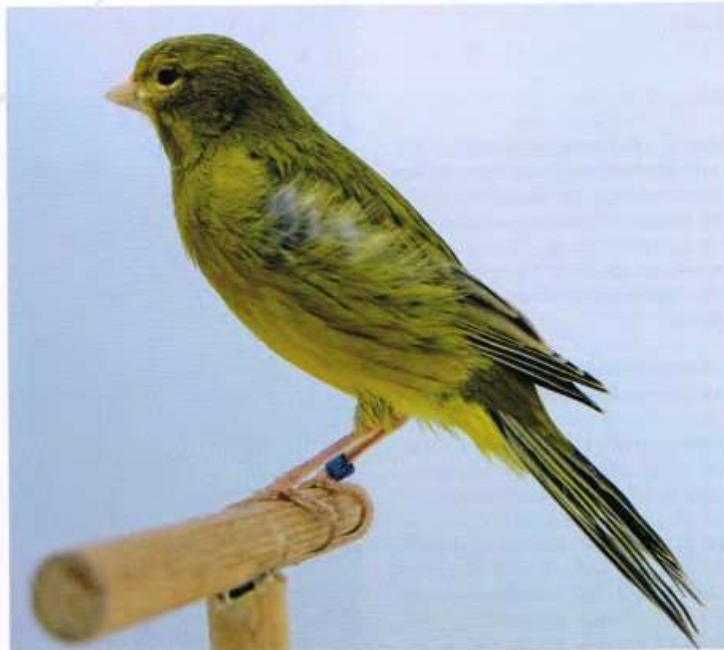
Een agaathoer is intensief waarvan de flankbevedering erg pluiziger is, de vleugelpennen wat kruisen en de staart niet netjes gesloten is.

Behalve te lang, kan de bevedering ook plaatselijk ontbreken. Dit kan b.v. een kaal plekje op de kop zijn. Ook komen we met name lichte vogels tegen,