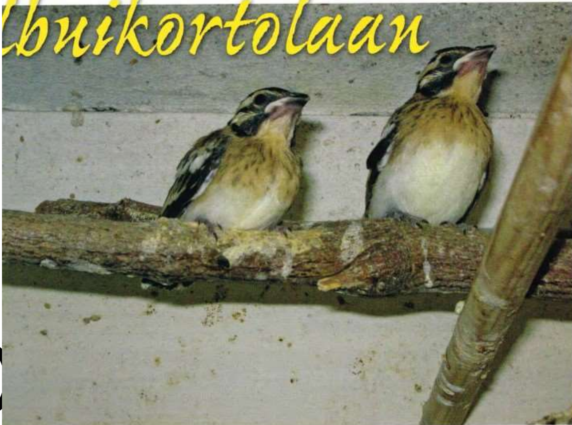
2 jonge geelbuikortolanen, ongeveer 4 weken oud