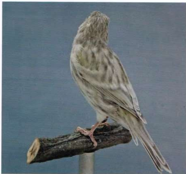
Een agaat onyx geel mozaiek die een te korte onvolgroeide staartpen toont.

Een volgende pen zal dan ook weer gedraaid te voorschijn komen. Een dergelijke vogel is derhalve niet meer geschikt als TI-vogel. Voor de kweek inzetten is echter geen enkel probleem. Een spreidstaart kan ontstaan, als de vogel onrustig is nadat hij in de showkooi is geplaatst. Met een eenvoudig plastic schermje aan de binnenzijde van de tralies is dit probleem te voorkomen. Na enkele vergeefse pogingen