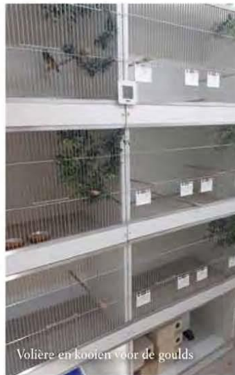
Volière en kooien voor de Goulds

aangeschaft waaronder blauwfazantjes, Sint-Helena fazantjes en goudbuikjes....En er kwamen ook wat koppeltje Goulds bij omdat deze mij blijven trekken..... De Afrikaantjes bleken niet mijn ding. Maar de Goulds bleven en ik heb een aantal goede koppels kunnen aanschaffen, zowel blauwe als wildkleur.