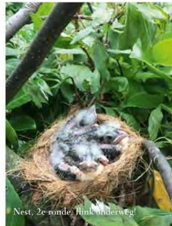
Nest, 2e ronde, flink onderweg!

Aangezien het buitendeel van mijn volières niet overdekt is heb ik maar een oude glasplaat op de volière gelegd, boven het nest. Dat werd goed geaccepteerd. Ik wilde het jong op de vijfde dag ringen met 3,5mm maar dat ging echt niet lukken. Dan maar 4mm. Het jong groeide voorspoedig op en sprong met elf (!) dagen al uit het nest. Dat was ik trouwens ook gewend met andere kardinalen en passerina's.