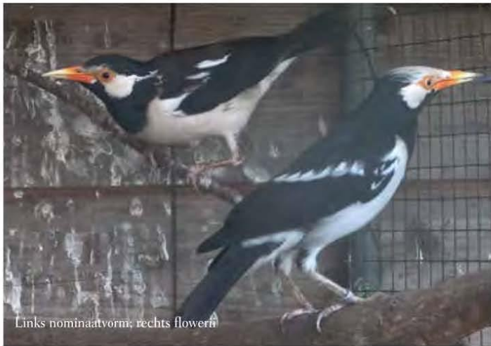
Links nominatvorm; rechts flowerii