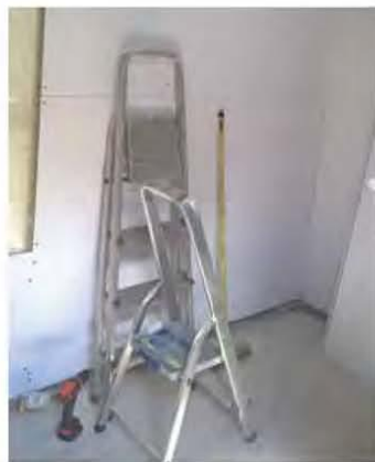
Wanden in aanbouw

Ik heb gekozen voor tempex en dit af te werken met gipsplaten. De bouw verliep super; de tempex sneed je mooi op maat en paste prima tussen de houten balken van de schuur. De gipsplaten plaatste ik niet verticaal maar horizontaal omdat ik dan minder nodig had en kwa bevestigen was dit gewoon beter. Nu moest ik nog balken maken voor een verlaagd plafond; dit ging vrij vlot. Ook hier isoleerde ik het geheel en werkte het af met gipsplaten. Meteen maakte ik TL-armaturen aan het plafond en een badkamer afzuiging. Ik maakte een luik in het plafond zodat je altijd bij je draden kan. Een Rimo2000 regelde het licht. Ook wou ik een kleine binnenvolière hebben en bouwde deze 80 cm diep over de breedte van de schuur. Nu was echt alles afgewerkt en kwam mijn doel in zicht....ik begon alles op mijn gemak af te kitten; elk naadje pakt ik mee om straks geen ongewenste beestjes te hebben. Na het afkitten werd alles, met hulp van mijn dochter, twee keer in de afwasbare latex gezet.