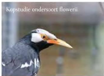
Kopstudie ondersoort flowerii