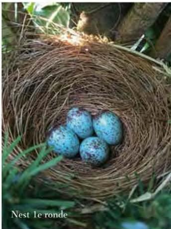
Nest 1e ronde