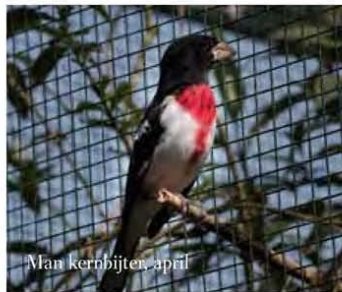
Man kernbijter, april

Deze keer drie eieren en ook drie jongen. Ook deze jongen werden goed door beide ouders verzorgd en met vijf dagen had ik wederom 4mm ringen nodig. Ik maakte mij in de laatste dagen voor het uitvliegen echter wel zorgen om de broeddrijf van de man. Deze broeddrijf is goed verklaarbaar: ik voer met name meelwormen aan de ouders en de jongen. En die zijn er in enorme hoeveelheden door heen gegaan. Op zich geen probleem, het is geen duur voer en door de meelwormen goed te voeren en ze extern te verrijken met vitamines en mineralen groeien de jongen goed. Echter, op de een of andere manier wordt de broeddrijf van de mannen hierdoor buitensporig aangewakkerd. Deze ervaring heb ik met meerdere soorten vogels gehad, van