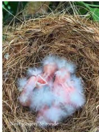
Nest jongen 2e ronde