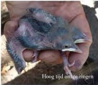
Hoog tijd om te ringen