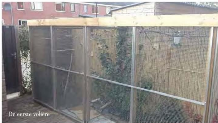
De eerste volière