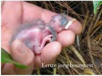
Eerste jong boomnest