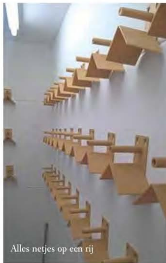
Alles netjes op een rij