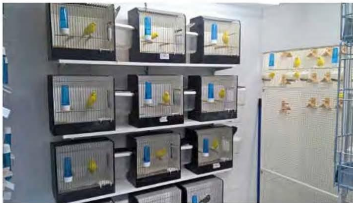
Kanaries op de stellingen

Van het een kwam het ander. De buitenvolière was overbodig geworden omdat alles in de schuur zat ondergebracht en dit beviel mij prima. Ondertussen had ik de vogels van de hand gedaan omdat dit geen wedstrijdvogels waren. Ik wou eens met een TT mee spelen en kocht een paar hele mooie koppels gele intensieve en schimmel kanaries bij een goede kweker. De volière werd afgebroken en de tuin weer netjes bestraat; ondertussen ging het goed met mijn aangekochte koppels gele kanaries.....het werd kouder en ja dan moet je gaan verwarmen om dadelijk te kunnen kweken in de winter. Zo gezegd zo gedaan; ik kocht een elektrische kachel.....stelde hem in op 1000 Watt en rond de 18 graden... de kweek begon. Het ging goed met de vogels; de kweek verliep prima voor het eerste jaar met de gele en ik kweekte wat leuke vogels.....Maar ja ik verwarmde een houten schuur die niet geïsoleerd was.....toen kwam de afrekening waar ik al een beetje bang voor was. Ik moest 600 euro bijbetalen aan stookkosten... achteraf had ik het kunnen weten maar ja....De vogels hadden het warm gehad en daar deed je het voor. Ik speelde bij de vereniging in de buurt mee met de tentoonstelling; dit was een leuke ervaring om mee te maken zoveel vogels en zoveel gele kanaries...ik vond het erg leuk om mee te doen, niet zozeer om het winnen.