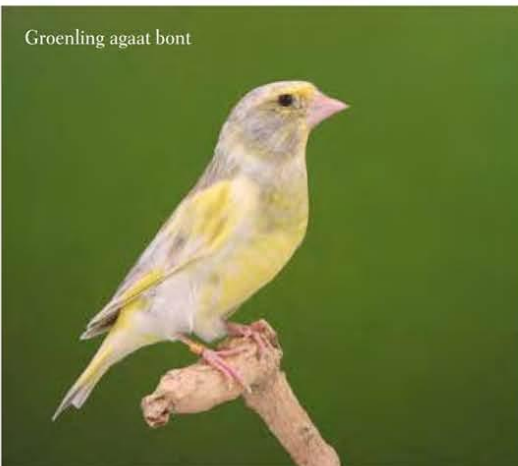
Groenling agaat bont