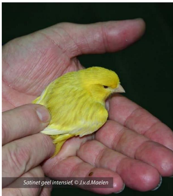
Satinet geel intensief