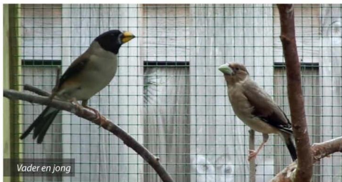
Vader en jong

De jongen werden voornamelijk gevoerd met dierlijk voedsel. Bij mij werden ze