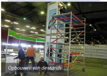
Opbouwen van de stands