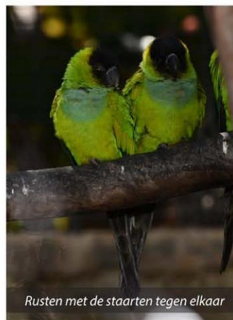
Rusten met de staarten tegen elkaar