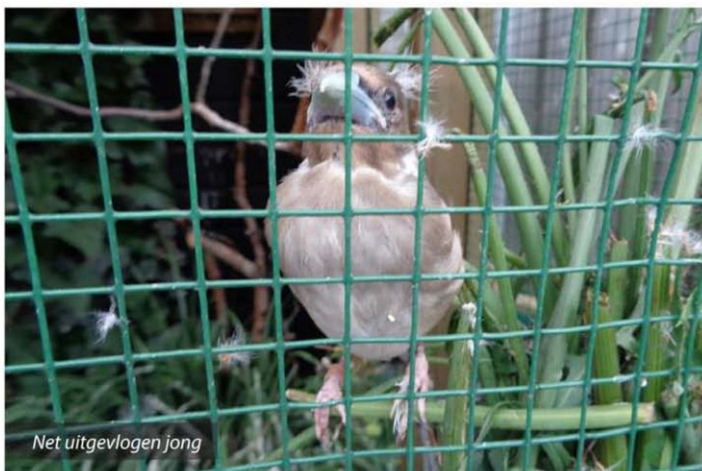
Net uitgevlogen jong

gevoerd met pinkies en hermetia larven uit de diepvries en levende pas vervelde meelwormen. Bij de diepvriesinsecten mengde ik een paar druppels tarwekiem olie waarna ik ze bepoederde met een insecten strooipoeder voor de nodige calcium en mineralen. Ook de meelwormen werden bepoederd maar hierbij werd de tarwekiemolie achterwege gelaten. De appelvinken werden vóór aanvang van het broedseizoen al gewend aan het diepvriesvoer. Vooral aan de hermetia larven (larven van de soldatenvlieg) moesten ze eerst heel erg wennen. Maar eenmaal de smaak te pakken aten ze dit graag. Eivoer werd naar mijn idee niet gegeten. Wel zag ik de ouders onkruidzaden zoals paardenbloem voeren en kruiden zoals vogelmuur. Ook het binnenste van een paprika met daaraan de paprikazaden werd graag gegeten en gevoerd. Zowel de pop als de