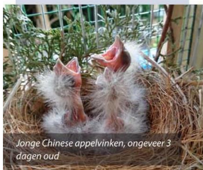
Jonge Chinese appelvinken, ongeveer 3 dagen oud