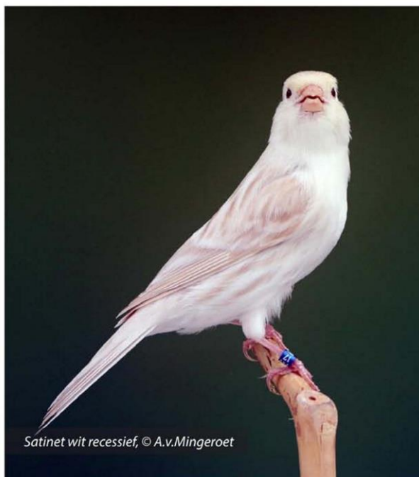
Satinet wit recessief

Gelukkig is deze vogel weer volop in het daglicht en op alle wedstrijden weer te bewonderen. De kwekers zijn er zich weer van bewust dat met deze vogel weer eer valt te behalen en terecht dank