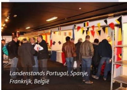
Landenstands Portugal, Spanje, Frankrijk, België