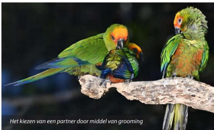
Het kiezen van een partner door middel van grooming