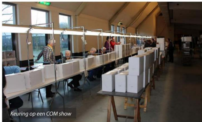
Keuring op een COM show

De organisatie begint al in de maand augustus, voorafgaand aan de show van het volgende jaar. In augustus worden het land van organisatie en de data van de show bekend gemaakt. In deze eerste vergadering wordt een eerste begroting opgesteld op basis van bekende prijzen van bushuur, dieselkosten, tolkosten en de te rijden afstand. Ook wordt dan ingeschat met hoeveel chauffeurs er gereden moet worden (afhankelijk van de plaats waar de COM show georganiseerd gaat