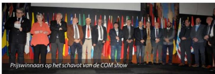
Prijswinnaars op het schavot van de COM show

Het liefst laat de convoyeur de vogels meteen overspringen van transportkooi naar wedstrijd-kooi zonder deze in de hand te nemen. Wanneer een vogel echter wat besmeurd is zal de convoyeur hem ter hand nemen en zo goed en zo kwaad als het kan reinigen. Zou hij dat niet doen: een vuile vogel valt nooit in