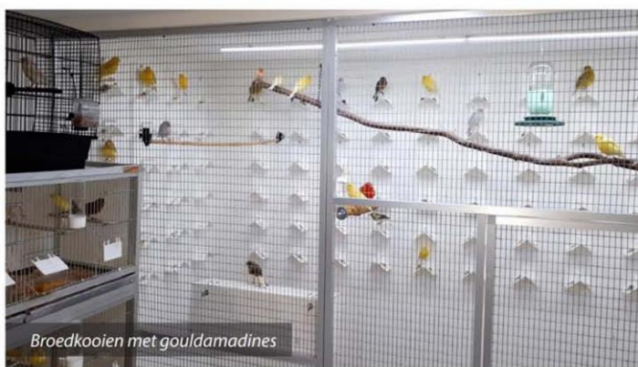
Broedkooien met gouldamadines

Een oproep die ondergetekende, als hoofdredacteur van het bondsblad, graag onderschrijft.