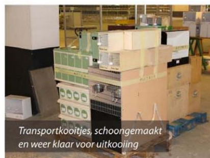
Transportkooitjes, schoongemaakt en weer klaar voor uitkooiing

En die vogels dan? Die worden door de liefhebbers bij het opkooien voorzien van volop voer en water (in fonteintje met sponsje om knoeien van water te voorkómen) of appel (voor papegaaiachtigen omdat die eventuele fonteintjes kapot maken). De vogels hebben dus altijd voer en vocht in hun nabijheid. Sommige vogelsoorten als toerako's of lori's moeten tijdens de reis wél van extra voer worden voorzien. Daar wordt rekening