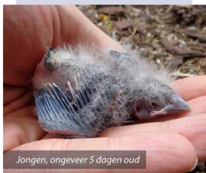
Jongen, ongeveer 5 dagen oud