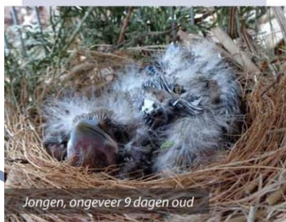
Jongen, ongeveer 9 dagen oud

feren, hulst en klimop, maar deze waren niet goed bestand tegen de knaaglust van de appelvinken.