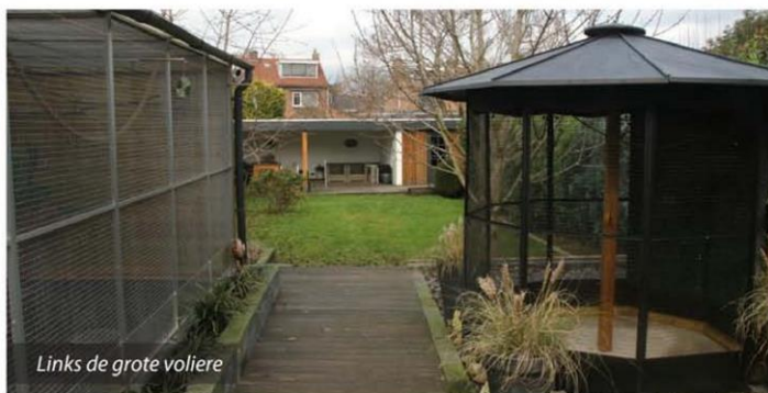
Links de grote voliere

gekocht bestaat de collectie uit een bont gezelschap. Het afgelopen jaar werd met zo'n dertig kleurkanaries gefokt in de grote volière. Er werden zo'n 35 nestkastjes opgehangen. De resultaten waren uitstekend. Op het eind van het broedseizoen vlogen er zo'n 120 kanaries in de grote volière. De kweek was dus uitstekend verlopen. In de garage werd overigens met enkele koppels kanaries gericht gekweekt. Hier werden onder andere agaatopalen gekweekt.