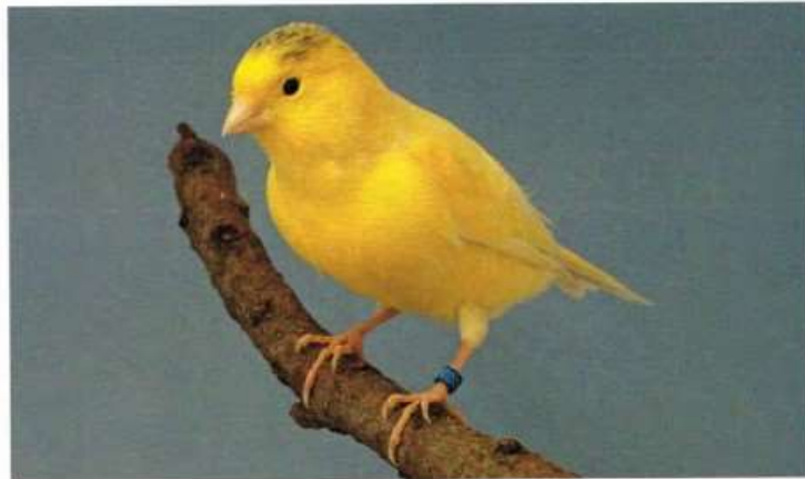
Waterslager uit de kampioensstam van WJBM Kling - PO

Helaas kan op een evenement van deze omvang niet alles goed gaan en zit er aan de publieke kant van deze bondsshow een donkere rand. Een bezoeker werd onwel en hoewel deskundige hulp direct ter plaatse was mocht die niet meer baten. Onze gedachten gaan uit naar de nabestaanden.