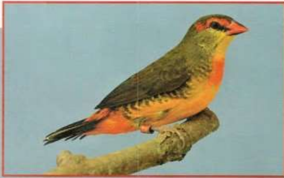
Goudbukje - man