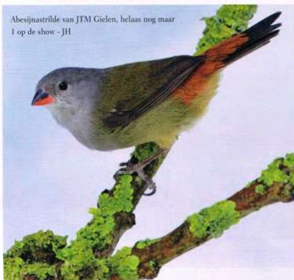
Abesijnastrilde van JTM Gielen, helaas nog maar 1 op de show - JH