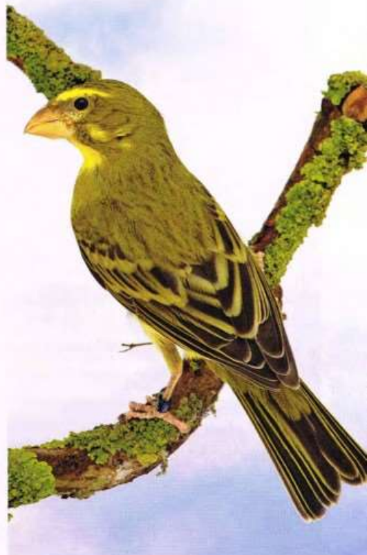
Zwavelgele dikbekcini van B Huijbers. Goud met 92 punten - JH