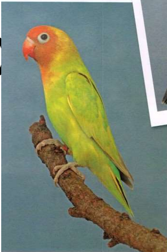
Agapornis nigrigenis dilute groen van H vd Biggelaar - PO