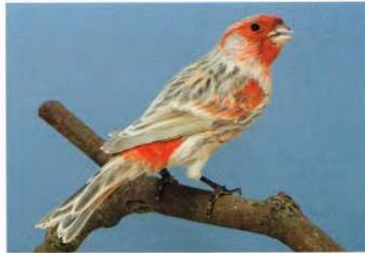
zwartopaal roodmozaiek type 2

Wanneer wij aan interessante wedstrijden willen meedoen, moeten wij leren leven met afstanden maar vooral ook met files. Toch hebben wij als NKC daar oog voor en begrijpen wij ook dat het niet zo uitdagend is om uit Maastricht of Leeuwarden even naar een show te gaan in Rotterdam e.o. Maar vanuit Rotterdam naar bijvoorbeeld Apeldoorn is precies zo lastig.