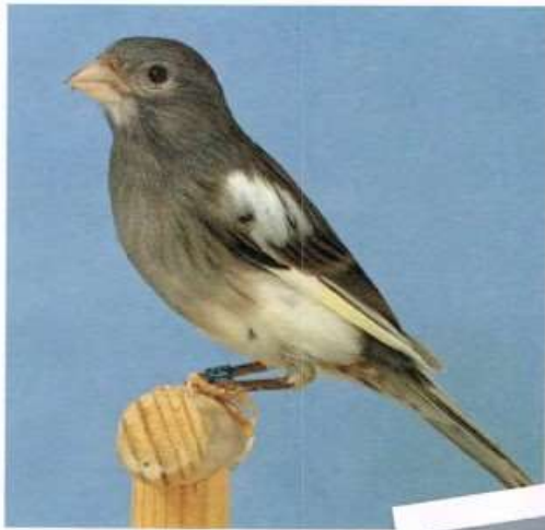
Raza español bont schimmel, van 92 punten met goud