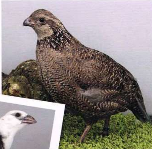
Virginische Boomkwartel van de heer D Korf. Een vrij nieuwe opvallende kleurmutant. Ook in prachtconditie gebracht en gewaardeerd met 93+ punten. Kampioen in zijn hoofdgroep - PvdH