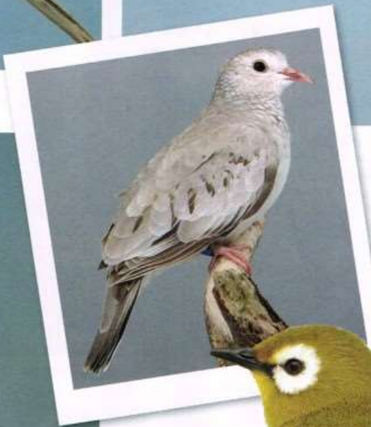
Musduifje van H Rozenberg. Ook van dit duifje dus al een kleurmuntant! In goede conditie gebracht en door de keurmeester gewaardeerd met 92 punten - PvdH