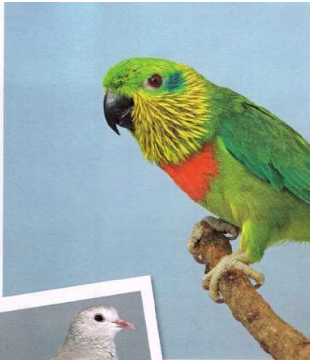
Salvadori vjigpapegaai van HJ Eikenaar - PO