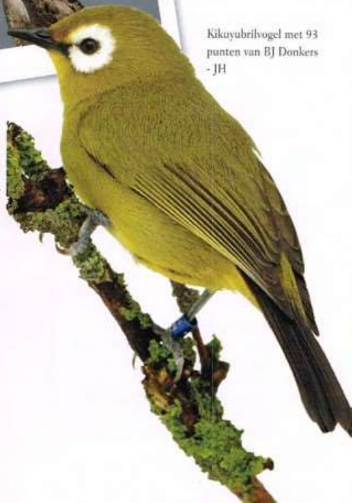
Kikuyubrilvogel met 93 punten van BJ Donkers - JH