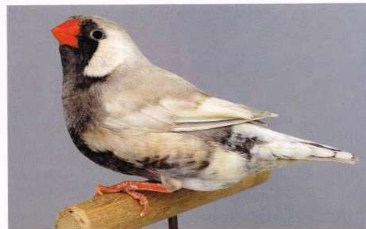
Een zebrafinck in de kleur pastel zwartborst blackface grijs, van J Kikkert. Combinatiemogelijkheden zijn er bij zebrafincken te over. De laatste jaren zijn enkele pastel - blackface combinaties geshowd waarbij opvalt dat per veerveld de reductie verschillend is. Zo ook hier: masker en buik zwart, maar borst grijs. Zowel pastel- zwartborst- en blackface kenmerken goed aanwezig: beloond met 91 punten - PvdH >