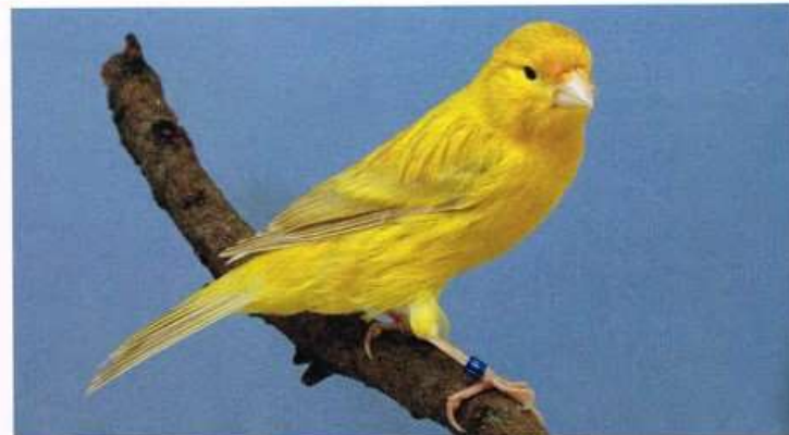
Isabel geel intensief van H van Hout, kampioen met 93 punten - PO