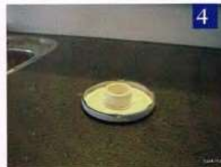
foto1: Het dekseltje boven een nestplaats foto2: Zitstok en nestkastje voorzien van bloedmijtval foto3: Een voorbeeld in praktijk foto4: Het dekseltje met de afstandhouder