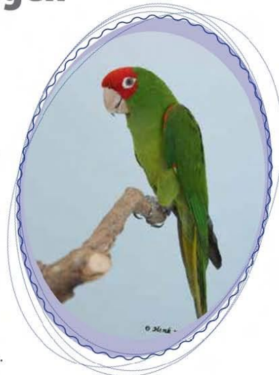
Guayaquil aratinga ( Aratinga erythrogenys )

Thuis worden de foto's uitgezocht en gerubriceerd. Goed rubriceren is belangrijk want je wil later een bepaalde foto natuurlijk graag kunnen terug vinden.