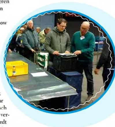
Inbrengen Nederlandse vogels, K.Snijder

is die stam kansloos voor een prijs. De meeste inzenders sturen vaak enkele vogels in als 'enkeling'. De convoyeur kan dan zo'n enkeling in de stam plaatsen in plaats van de originele vogel. Op die manier behoudt de liefhebber kans op een prijs.