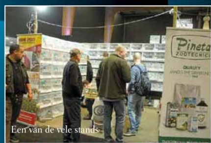
Een van de vele stands