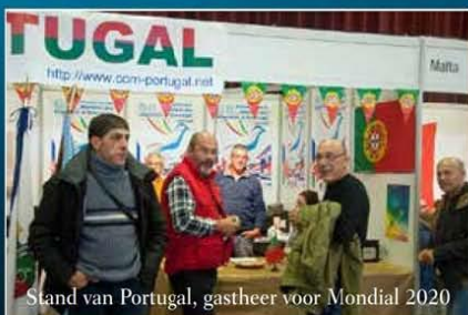
Stand van Portugal, gastheer voor Mondial 2020