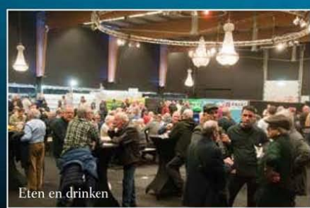
Eten en drinken