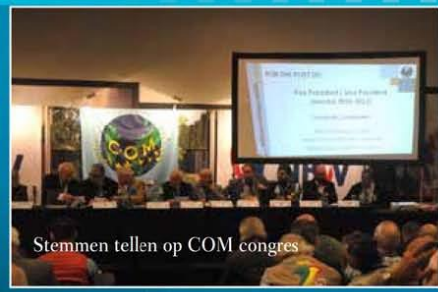
Stemmen tellen op COM congres