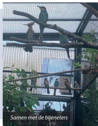
Samen met de bijeneters

en uit het nest? Het blijkt dat hij er met een op en neer gevlogen heeft. Het is dood en hij heeft het ergens verstopt of begraven. Jammer maar vijf is ook niet verkeerd.