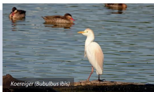
Koereiger ( Bubulbus ibis )