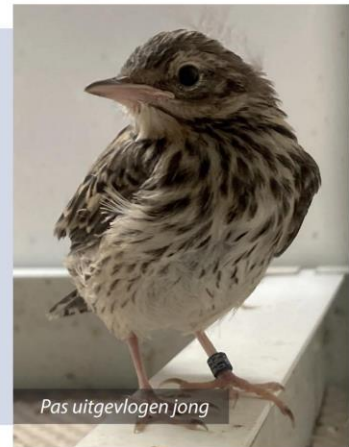
Pas uitgevlogen jong

wijderd? Of is het jong uit het nest verwijderd en daarom doodgegaan? En waarom dan in beide gevallen? Was het de hitte? (Temperatuur boven de 30 graden Celsius). Ik wilde met het laatste jong geen risico lopen en besloot dat handmatig groot te brengen. Direct ook maar geringd met de voorgeschreven maat van 2,5mm. Een papje van eigengemaakt eivoer, met Nutri-