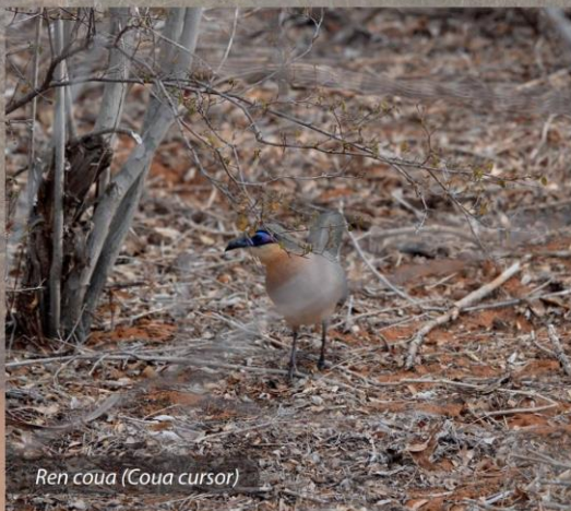
Ren coua ( Coua cursor )