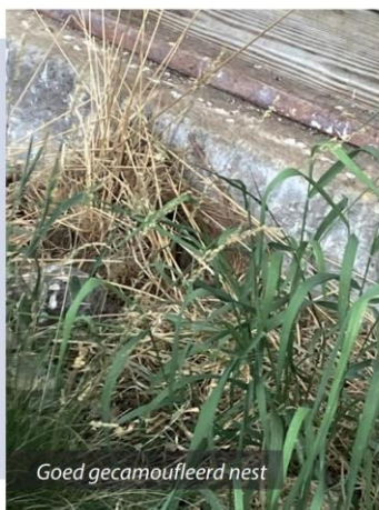
Goed gecamoufleerd nest

Dit jaar werd er opnieuw genesteld op de-