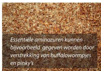
Essentiële aminozuren kunnen bijvoorbeeld gegeven worden door verstrekking van buffalowormpjes en pinkies