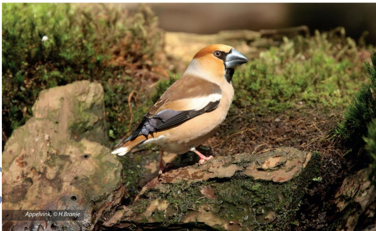
Appelvink, © H.Branje

Van de andere kant kan ik me voorstellen dat zo'n beginnening toch zijn zinnen heeft gezet op deze soort vogels omdat dat voor hem het mooiste is. En je weet het, ik schrijf het vaker, je moet die vogels aanschaffen waarvan je denkt het meeste plezier te zullen hebben. Daarom ben ik ook op zoek gegaan naar Europese cultuurvogels. Maar geloof me, er is niet gemakkelijk aan te komen. Er waren een paar bekende adressen, maar de vogels die ik daar kon kopen stonden mij niet aan of waren naar mijn mening te duur. Toch zijn er nu al de eerste