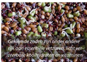
Gekiemde zaden zijn onder andere rijk aan essentiële vetzuren, licht verteerbare koolhydraten en vitaminen