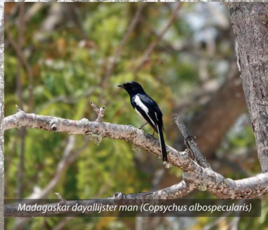
Madagaskar dayallijster man ( Copsychus albospecularis )