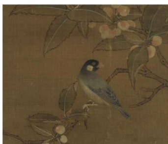
Rijstvogel op kersentak, 15th century, Ming Dynasty (China)