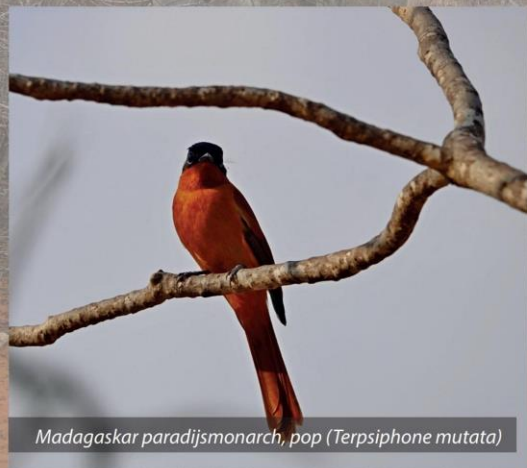
Madagaskar paradijsmonarch, pop ( Terpsiphone mutata )