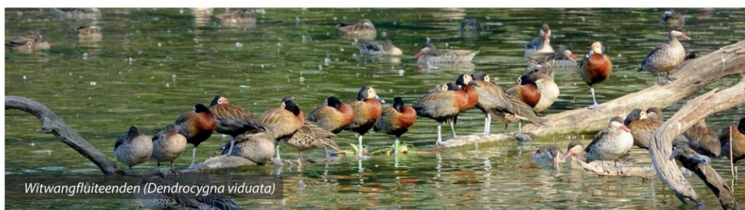
Witwangfluiteenden ( Dendrocygna viduata )

Voor de avond had onze gids een avondwandeling bedacht om lemuren te spotten. Lemuren of maki's zijn halfapen die endemisch zijn op Madagaskar, met uitzondering van enkele soorten op omliggende eilanden. Er zijn meer dan 80 verschillende soorten lemuren of maki's! De meest bekende maki is de ringstaartmaki. Tijdens de avondwandeling zagen we in de holte van een boom een dwergmuismaki die ik, met wat bijlichten van een zaklantaarn, kon fotograferen.