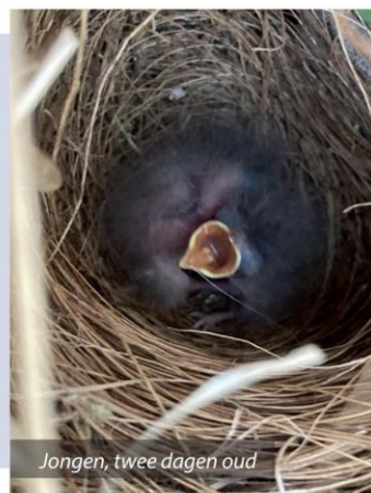
Jongen, twee dagen oud