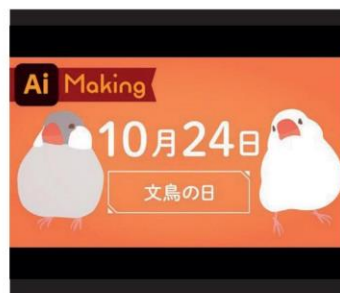
'Buncho no Hi'

Uiteraard is Buncho no Hi ook een goed moment voor eigenaren om de vogels eens extra te verwennen en voor de detailhandel om allerlei rijstvogelproducten te verkopen. Ze worden in de populaire cultuur van Japan en andere Aziatische