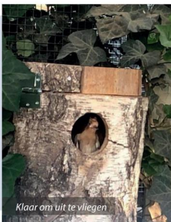
Klaar om uit te vliegen