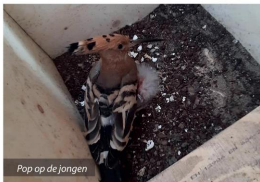
Pop op de jongen

berkenblok en een liggend blok waarvan het nestgedeelte iets dieper lag. Als bodembedekking gebruikte ik een laag tuinaarde gemengd met zand. De vogels toonden veel interesse in het berkenblok en de man zat er soms wel meer dan een uur in. Half maart werd er best wat gejaagd achter elkaar en liet de man ook zijn "leuke" roep horen. De vogels verbleven nu steeds vaker samen in de liggende kast en begin april kon ik mijn nieuwsgierigheid niet meer de baas en bleek dat er al twee eieren lagen. Nu was het afwachten en vooral opletten of de man de pop wel goed zou voeren aangezien deze volgens de meeste verhalen niet meer van het nest komt voordat de jongen zijn uitgevlogen. In mijn geval was het anders want ik zag de pop regelmatig uit de kast komen en ook bleef ze zelden zitten wanneer ik controle deed. De hop blijft op het nest vanaf het eerste ei en er werden er in totaal acht gelegd. De eieren verkleuren tijdens het broeden en ik kon bij een controle goed zien dat zeven van de acht mooi donker gekleurd waren. Na 16 dagen broeden kwamen de jongen uit het ei en ik ringde ze op de vierde dag met ringmaat 4.5. Ondanks het verschil leeftijd en grootte deden de jongen het prima. Ik voerde naast de meelwormen geen moriowormen meer maar veel wasmotten, krekels en pinkies. De man voerde de pop en de jongen erg goed en wanneer hij niet aan het voeren was dan was hij wel aan het roepen. Na een kleine drie weken vloog het eerste jong