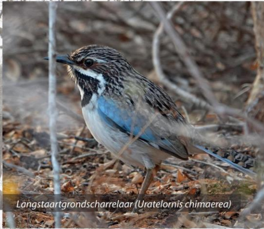
Langstaartgrondscharrelaar ( Uratelornis chimaerea )