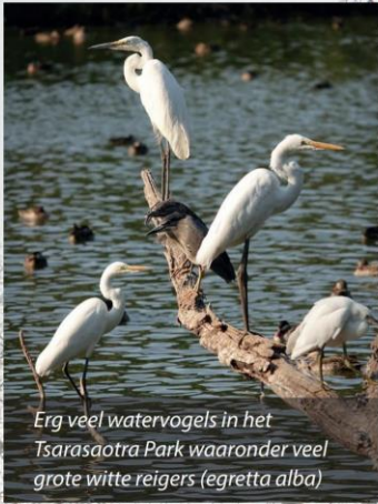
Erg veel watervogels in het Tsarasaotra Park waaronder veel grote witte reigers ( egretta alba )