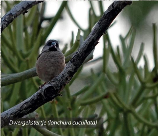
Dwergkestertje ( lonchura cucullata )