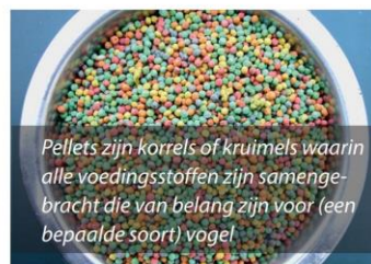
Pellets zijn korrels of kruimels waarin alle voedingsstoffen zijn samengebracht die van belang zijn voor (een bepaalde soort) vogel