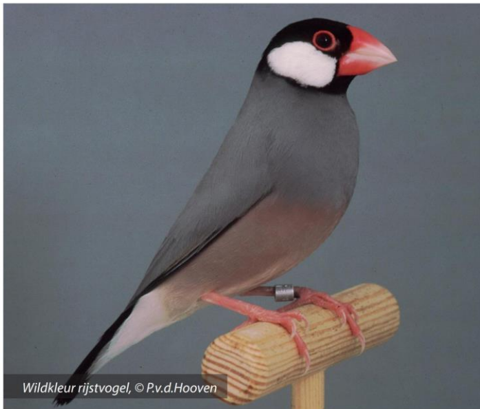
Wildkleur rijstvogel