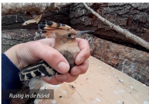
Rustig in de hand

Een geweldige mooie vogel met een vlinderachtige vlucht. Voor mij een van de mooiste vogels die ik tot nu toe gehad heb. De hop trekt steeds meer naar het noorden om te broeden. Er zijn in de afgelopen jaren al enkele broedgevallen bekend in Nederland. Het zou mooi zijn wanneer de hop straks geen zeldzaamheid meer is maar we ook in de natuur kunnen genieten van deze schoonheid.