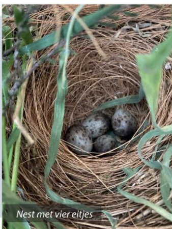
Nest met vier eitjes