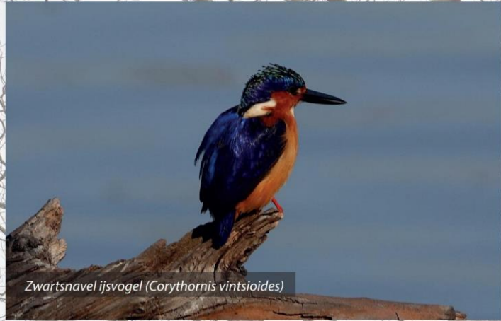
Zwartsnavel ijsvogel ( Corythornis vintsioides )