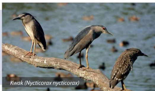
Kwak ( Nycticorax nycticorax )