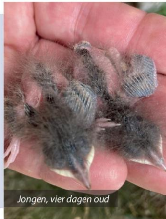
Jongen, vier dagen oud

zelfde manier. De man zong beduidend harder dan een jaar geleden. Er werden nu vier eitjes gelegd die wél bebroed werden. Het mannetje hield de wacht, floot zijn kenmerkende lied en waarschuwde het popje voor aankomend gevaar (ik dus, bij het verzorgen). Het voer dat ik verstreekte was een insectenpatee met pinkies, levende buffalowormpjes, witte meelwormen, (diepvries) krekeltjes en fijngeknipte wasmotlarven. Alles afwisselend bestoven met Gistocal of Triovit. Na dertien dagen broeden kwamen twee jongen uit; de resterende eitjes waren spoorloos verdwenen. De witte meelwormen waren veruit populair en ik moest alle mogelijke moeite doen om die in voldoende mate te verstrekken. Het popje bleek erg honkvaast en verliet het nest zelden. Omdat ik haar niet wilde verjagen voor een nestcontrole, moest ik steeds mijn kans grijpen als ze van het nestje af was. De jongen groeiden mooi samen op, tot ik op de vijfde dag een van de jongen dood aantrof op de stenen, waar het in de hete zon lag te bakken. Mijn hart sloeg een slag over! Zou het doodgegaan zijn in het nest en daarom door de ouders zijn ver-