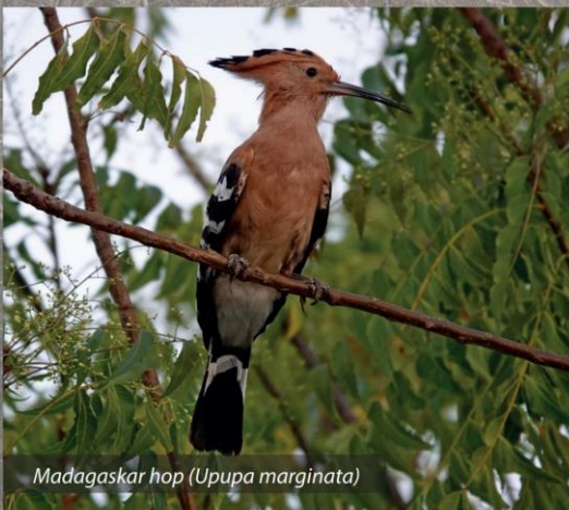
Madagaskar hop ( Upupa marginata )