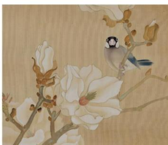
Witte Magnolia, rijstvogel – Ishizaki Koyo 1884-1947 (Japan)