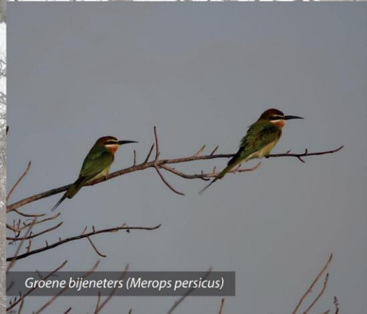
Groene bijeneters ( Merops persicus )