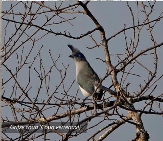
Grijze coua ( Coua verreauxi )