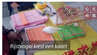
Rijstvogel kiest een kaart

Na de harten van de Chinezen, veroverde de vogel ook de harten van de Japanners. Al tijdens de Tokugawa Shogunaat (dynastie) die duurde van 1603 tot 1867 werden rijstvogels vanuit China geïmporteerd. De vogels werden alom als kooivogels gehouden. Handopfok van jonge rijstvogels was een favoriete bezigheid. Evenals in China verwilderde de rijstvogel ook in Japan. In een handboek over Japans eten (Honho Shokkan) uit de zeventiende eeuw wordt de rijstvogel beschreven. De soort zou volgens het boek een nieuwkomer in het land zijn. Ook beschrijft het boek dat groepen van twee- tot driehonderd rijst-