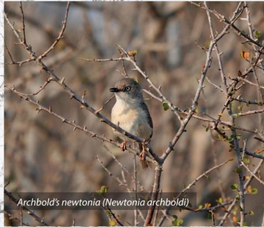
Archbold's newtonia ( Newtonia archboldi )