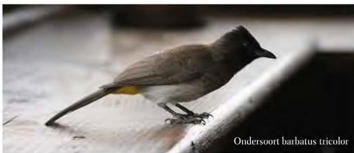
Ondersoort barbatus tricolor

P. b. schoanus tenslotte leeft van Zuid-Soedan tot Ethiopië en Eritrea.