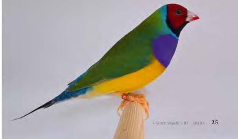
Man roodkop groen paarsborst

Ik wens jullie veel plezier met het gebruik van de Gouldamadine Calculator. <