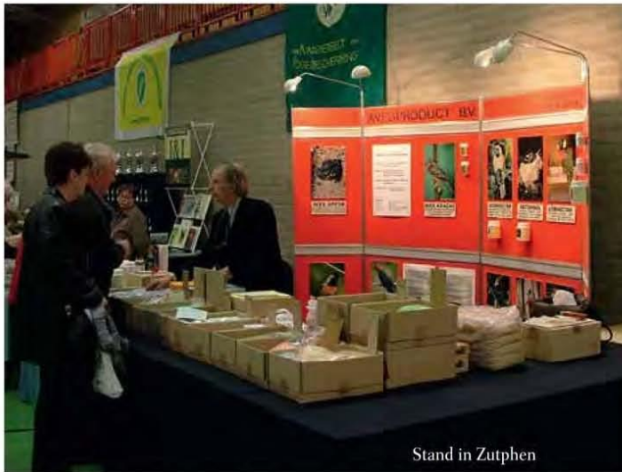
Stand in Zutphen

› hij dat het wel snor zat met de aan de vogels verstrekte voeding. Alles moest hij zelf uitvogelen. Het wegen van wat de vogels eten; het uitrekenen van hetgeen de vogels aan voedingsstoffen opnemen met de verschillende hoeveelheden van de diverse zaden en andere voedingsmiddelen. De gegevens van de voedingsstoffen (onder andere eiwit, vet, koolhydraten, mineralen, sporenelementen) van heel veel producten zijn destijds ook opgenomen in het boek 'Voeding van vogels'.