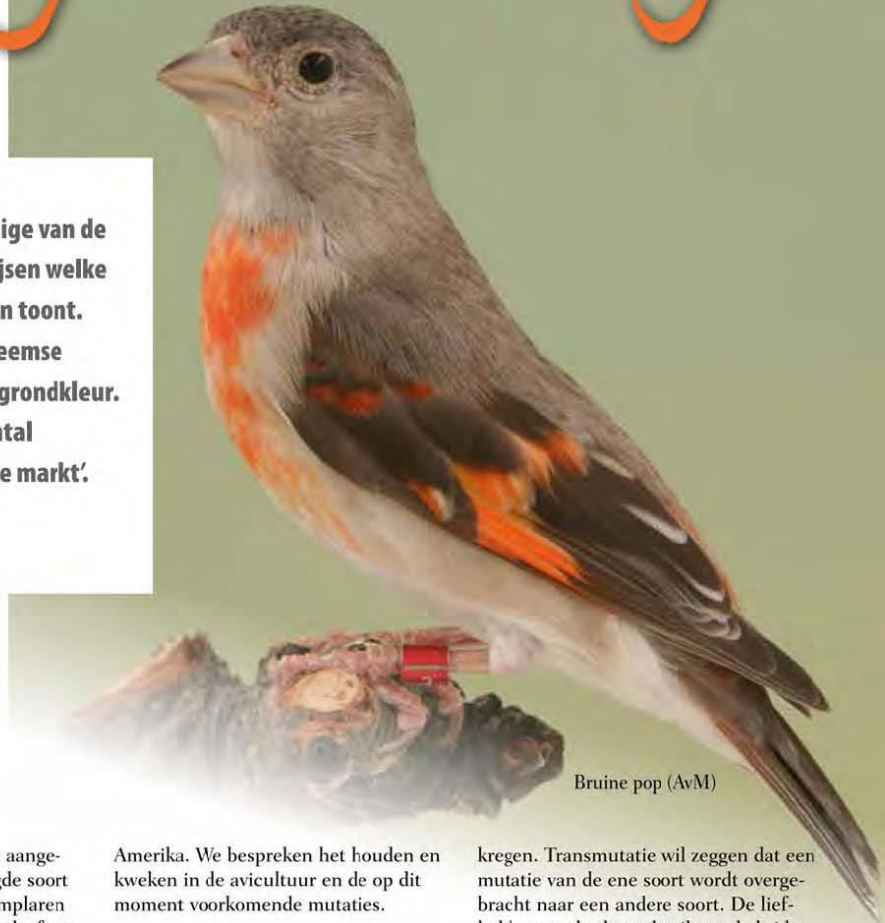
Bruine pop (AvM)

D e kapoetsensijs wordt aange-merkt als een bedreigde soort omdat het aantal exemplaren dat voorkomt in de natuurlijke leefomgeving in Zuid Amerika snel afneemt. Binnen de vogelliefhebberij is op dit moment de Kapoetsijs samen met de Magellaansijs, Carduelis magellanica , de meest gehouden en gekweekte uitheemse sijzensoort. De laatste jaren is een aantal mutaties beschikbaar. Deze mutaties zijn afkomstig van hybride kweek met andere soorten sijzen. In dit artikel gaan we in op de Kapoetsensijzen in de natuurlijke leefomgeving in het noorden van Zuid