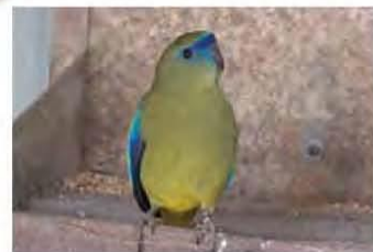
Rotsparkiet, gefotografeerd bij Morrie