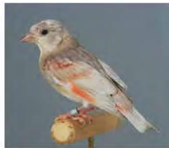
DF pastel pop (PvdH)

De bruin mutatie vererft geslachtgebonden en recessief. Een man kan dus split zijn een pop niet. De mutatie zorgt voor het niet volledig uitkleuren van het eumelanine tot zwart. Dit uitkleuren wordt ook wel oxyderen genoemd. Alle veren die bij de Kapoetsen sijs zwart