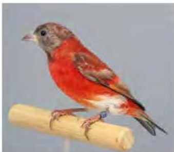
EF pastel man (PvdH)

kweken raden we je aan geen gebruik te maken van het kweken van hybriden. Het is beter om op zoek te gaan naar kwekers van de bruine kapoetsensijs. Je kunt bij deze kwekers dan proberen vogels aan te schaffen. Dit voorkomt de kweek van een flink aantal hybriden zonder wezenlijke functie en zijn de lastige stappen in de eerste generaties al door een andere liefhebber gedaan.