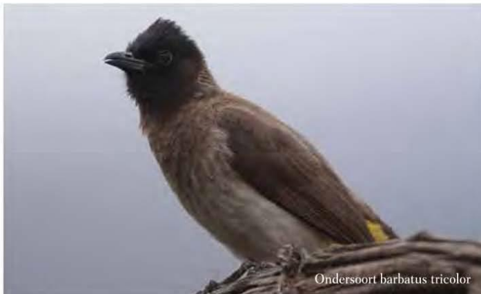
Ondersoort barbatus tricolor

P. b. arsinoe leeft verder maar het noordoosten, van Tsjaad tot Egypte en Soedan.