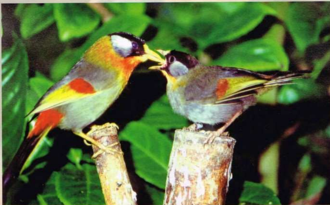
Pa zilveroornachtegaal ( Leiothrix argentea ) voert zijn jong.

Onze activiteiten zijn erop gericht om onze doelstellingen, vastgelegd in ons huishoudelijk reglement, te realiseren. Samengevat komt dit erop neer, dat we alles in het werk zullen stellen om het verantwoord vogels houden en het succesvol fokken op vele manieren