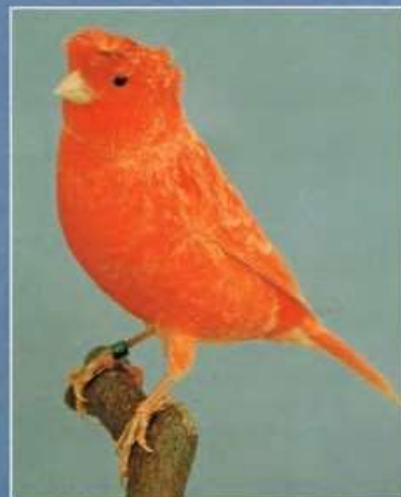
Duitse kuif rood schimmel

De houdingrassen (Lancashire, Berner, Rheiñländer, Llarget Espanol, Capitolina, Bayernpfeil, Belgische