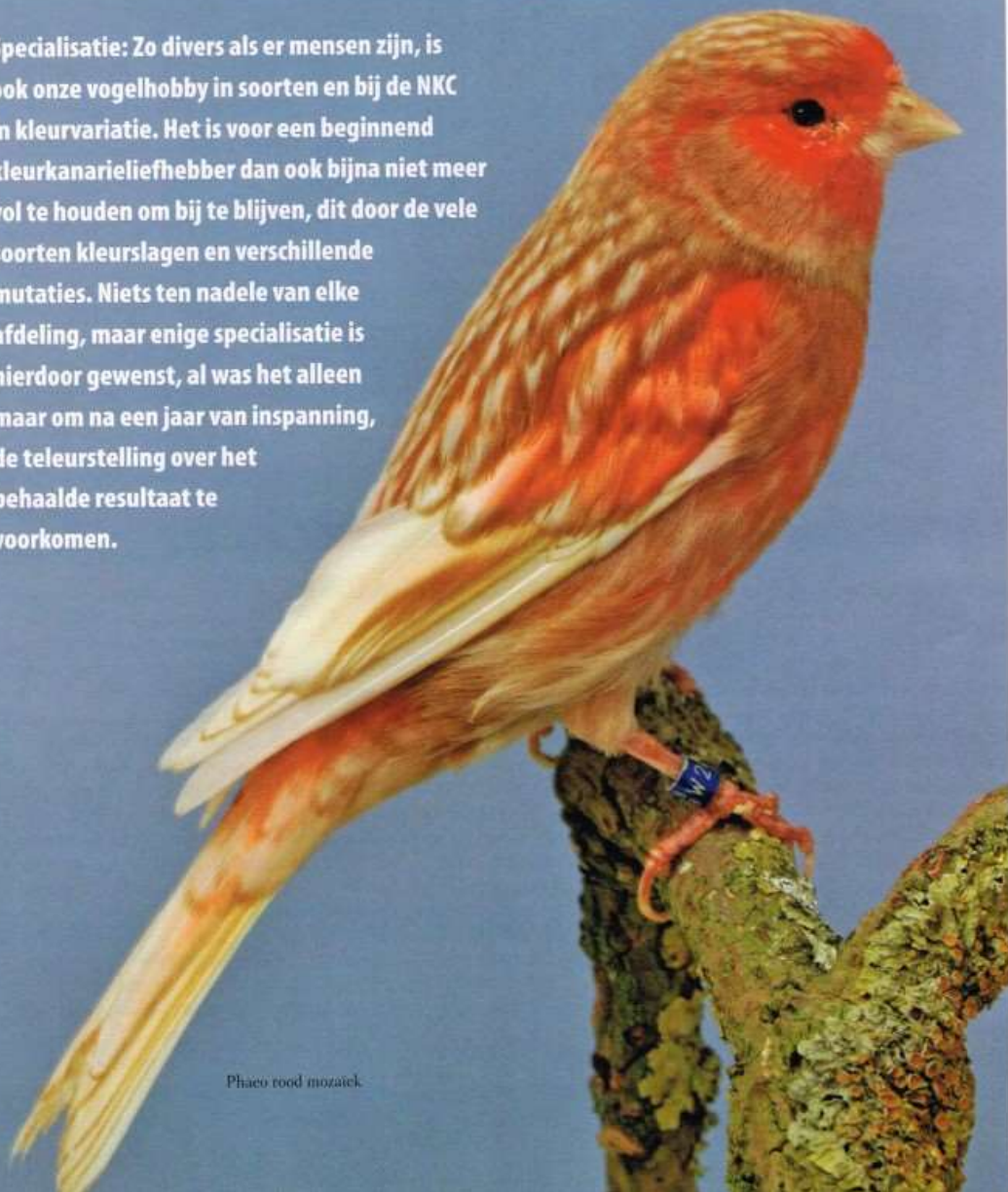
Phaeo rood mozaiek

Specialisatie: Zo divers als er mensen zijn, is ook onze vogelhobby in soorten en bij de NKC in kleurvariatie. Het is voor een beginnend kleurkanarielifhebber dan ook bijna niet meer vol te houden om bij te blijven, dit door de vele soorten kleurslagen en verschillende mutaties. Niets ten nadele van elke afdeling, maar enige specialisatie is hierdoor gewenst, al was het alleen maar om na een jaar van inspanning, de teleurstelling over het behaalde resultaat te voorkomen.