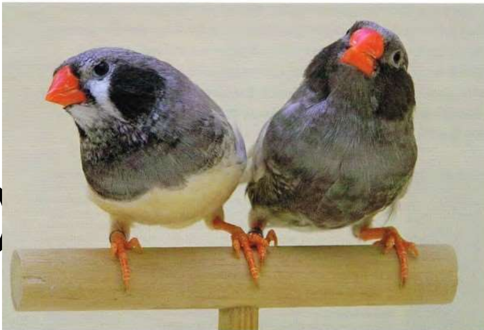
Een pastel zwartwang zwartborst (links) en een pastel zwartwang zwartborst blackface (rechts)

zullen meer exemplaren van deze fraai kleurslag gekweekt worden. Dan zal ook daar langzaam maar zeker een standaardbeschrijving voor worden opgesteld.