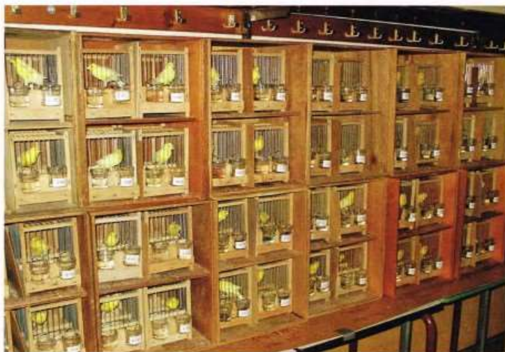
Na de keuring krijgen de vogels even gelegenheid te eten en te drinken