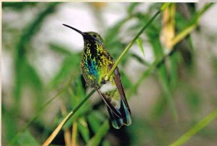
Gould's violetoorkolibrie – Colibri coruscans

Of kijk voor meer informatie op www.vogelspeciaalclub.nl