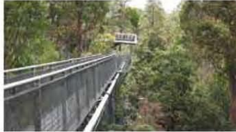
Brug tussen de boomtoppen

In Port Arthur stappen we in de gereedstaande bus die ons bij de baai afzet. We stappen in de boot en krijgen een knaloranje overall aan. Ieder krijgt, uit voorzorg, twee reistabletten en dan racen we af. We varen langs grillige uit het water opstijgende rotsen; sommigen staan gekanteld en de lijnen lopen zo schuin dat je denkt zelf omhoog te varen. Onder hangende kliffen door zien we de pinguïns en Jan van Genten ons op het gemak volgen. Wanneer de kliffen afvlakken liggen er tientallen zeerobben. Wanneer we dan dichterbij varen, komen ze allemaal in beweging. De motor van de boot verstoort de vissen en de Robben duiken om te eten. De schipper start de motor weer en we racen, stuiterend over de golven. In een rustpauze zien we de Zuidkarpers opspringen en een dikke rug van een walvis. We keren om en dan, in de riemen geklemd, racen we in volle vaart in ruim een uur terug. Wat een ervaring, onvergetelijk. Als we weer huiswaarts rijden, voert onze weg langs