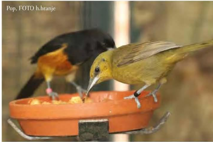
Pop, FOTO h.branje