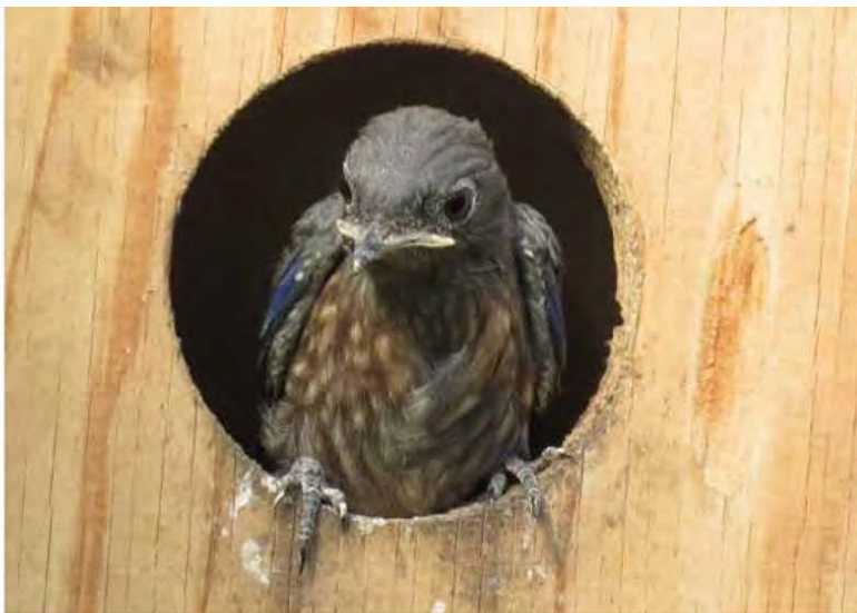
Nieuwsgierig de wereld in kijkend

Krekels gaan er met vele doorheen en ook zijn ze gek op diepvries hermetia.