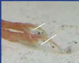
Knippen langs de witte lijntjes

Op de schone bodem komt een bodembedekker om de uitwerpselen op te vangen, want een schoon maar ook droog verblijf is het beste voor de