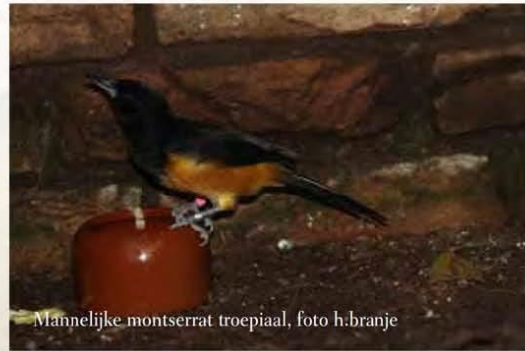
Mannelijke montserrat troepiaal

Door grote vulkanische activiteit op het eiland tussen 1995 en 1997 werd twee derde van het leefgebied van de troepiaal vernietigd. Het totale leefgebied van de soort beslaat tegenwoordig slechts 13 vierkante kilometer.