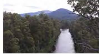
Uitzicht ovr de Huon rivier

veel baaien die 'gevuuld' zijn met zwarte zwanen. Al dobberend op het water foerageren ze met hun lange nekken onder water. In de meeste gevallen zien we ze als stellen. Met hun statige zwarte houding en rode snavel zijn het vogels waar wij graag even voor stoppen. Terug in ons huisje geniet ik nog even van een spreuwenest, waar de jongen op punt van uitvliegen staan. De alerte ouders reageren op alles wat maar enigszins in de buurt van het nest komt. We sluiten de dag af met een opkomende storm die ons is voorspeld. Omdat we dit al een keer ervaren hebben op onze reis genieten we van het comfortabele huisje. We vervolgen de reis naar het 7.14 hectare grote Geeveston Nationale Park Hartz Mountains.