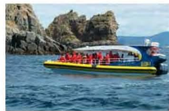
Uitzicht op de rotsen

We komen voor de Tahune Forest Air Walk. De boomtoppen wandeling begint bij de brug waar de 174km lange Huon rivier onder door stroomt. Deze stond een half jaar geleden onder water. Door veel regenval stond het water acht meter hoger dan normaal. De leuning waren weggespoeld en zijn op het moment dat wij er zijn keurig vervangen. Dan komen we bij de 112 treden tellende trap. Onderweg zijn plateau's waar we kunnen rusten en kijken. We klimmen hoger en hoger en we kunnen op verschillende hoogtes genieten van het uitzicht. Op elke hoogte verschillende vogelgeluiden. Een groepje geelbuikrosella's houden zich op rond rustbankjes. Na het spectaculaire uitzicht aan het einde van de boom-