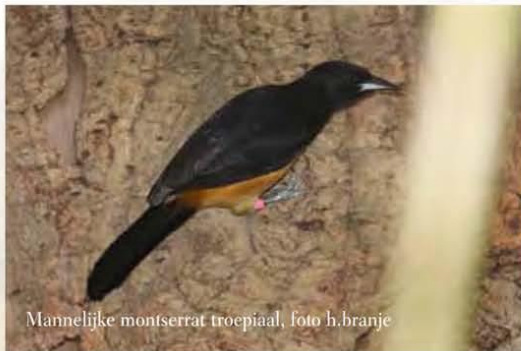
Mannelijke montserrat troepiaal