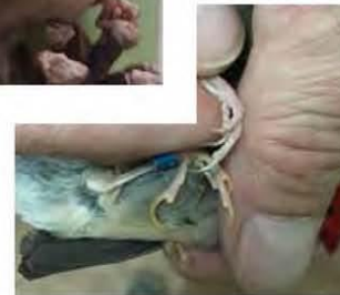
Man met gelere nagels dan pop

de buurt van een stabiele waterbron. Dornastrildes voeden zich op en bij de grond met zaden van grassen en onkruiden, en zaden in bessen en vruchten. Af en toe worden ook kleine insecten opgenomen.