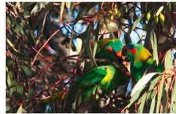
Muskulori's, verborgen tussen de bladeren

toppen wandeling wacht ons nog een prachtige route langs de Huon rivier. We lopen over de 130 meter lange wiebelende hangbrug (the swinging bridge) met eronder de snelstromende rivier. Wanneer ik de volgende morgen alléén deze weg volg, hoor ik de roep van de geelbuikrosella en fluit terug. Zo krijg ik contact, over en weer. In de boomtop zien we elkaar, ik met de camera en hij met zijn sierlijke rode voorhoofdsband. Dit is een bijzondere ervaring. Her en der liggen ontwortelde boomstammen die door flinke stenen op hun plaats blijven liggen om zich zo te hechten aan de hellingen. Zo kan ik aan het ontbijt mijn ervaringen delen. Wordt vervolgd <