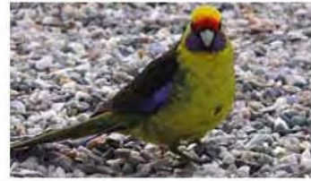
Geelbuikrosella ('green rosella')

verzamenen voor de winning van elektriciteit. De dubbel gekromde betonnen boog heeft een hoogte van 140 meter. Nabij het vliegveld van Hobart hebben we een huisje. De thermometer geeft hier ruim 30 graden aan. De paarsbloemige Bougainville siert aan een hek bij de ingang. De acht meter hoge Frangipani boom met de prachtige bloemen staat vlak naast onze cabin en trekken een scala van vogels aan. Ik zet er een stoel bij en de camera op scherp. Een stel Muskulories met al vliegvlugge jongen bij zich ritselen tussen de takken. Regelmatig worden ze gevoerd. Vanuit het grasland komt een rood kopje tevoorschijn. Het is de man Tasmaanse rosella ( Platycercus eximius diemenensis ); hij heeft lichtere boven delen en een prachtig geel met zwarte strepen gemarkeerd rugdek; deze ondersoort blijkt groter te zijn dan de gewone rosella.