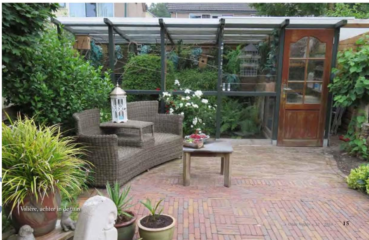
Volière, achter in de tuin

Soms zit het tegen, en dan prakkezeer je wat er niet goed gaat. Maar wanneer je dan deze mooie vogels ziet, weet je weer waarom je vogels hebt. Eind augustus gaan de vogels weg en in oktober verhuizen wij. Maar het vogelvirus verhuist gewoon mee. <