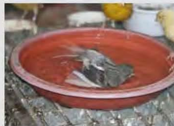
Badende fife fancy

hebben om zijn kanaries nog witter dan wit te krijgen. Soms zijn ze zelfs te wit en worden ze blauwig. Verder moeten we wel eens een beetje uitwerpselen verwijderen die zijn blijven plakken aan de veertjes onder de staart. Dan hebben we het wel zo'n beetje gehad met het 'opmaken' van onze vogels. Want zoals al eerder gezegd: een gezonde vogel zorgt er zelf voor dat hij er goed uitziet. Wij als liefhebbers moeten voor onze vogels alleen de juiste omstandigheden scheppen en de juiste middelen verstrekken. Dan kunnen we blijven genieten van al onze mooie vogels. <