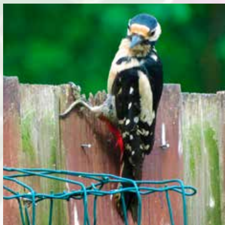
Grote bonte specht