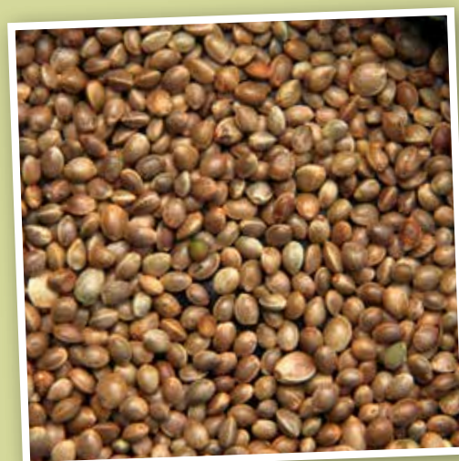
Hennepzaad (kempzaad). Zaad van de cannabisplant. In kleine hoeveelheden aan het mengsel toevoegen.

Vooraleer het hok te verlaten controleer ik altijd nog eens elke vlucht of de vogels allemaal hun natje en hun droogje gekregen hebben. Check en double check.