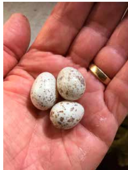
Onbevuchte eitjes van de rode kardinalen

Nog nooit heb ik bloedluis bij mijn Europese insecteneters gezien! Tot dit jaar dan.... Mijn al zelfstandige jonge boomkruipers, waar ik erg trots op was, zette ik voor de zekerheid (veiligheid)