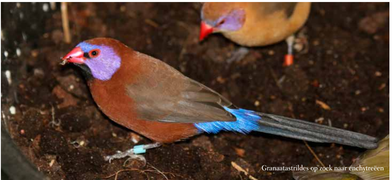
Granaatastrildes op zoek naar enchytreën