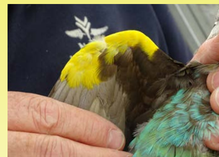
Binnenzijde van vleugelbocht

De stuitkleur moet nog egalier van kleur worden.