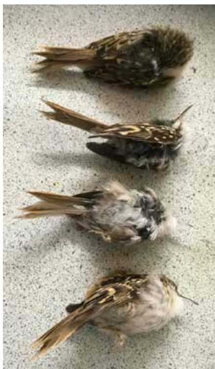
Dode boomkruipers, slachtoffers van de bloedluis

Mijn eerste jaar met de rode kardinaal. Een prachtige vogel, die ook nog eens bewonderingswaardig mooi fluit. Alleen ging na aankoop van een koppel de man vrij snel dood. Nou ja, een nieuwe man vinden is bij dit soort vogels niet zo moeilijk. Echter ging na enkele weken ook die nieuwe man weer dood. Weer een nieuwe gekocht met de nodige reserveringen. Zouden de vogels medicatie hebben gehad wat mij verzwegen was? Toen in de winter ook het vrouwtje slechter werd en er een vergrote lever zichtbaar werd (de vogels zaten binnen, onverwarmd), zonk de moed in mijn schoenen. Ik ging naar een ervaren kweker van kardinalen, die me aanraade Grog New van Dr. Coutteel te gebruiken. Dit is géén geneesmiddel, maar een preventiemiddel (tegen coccirose en atoxoplasmose) Ook plaatste ik de vogels naar buiten in een volière. Het vrouwtje kwam er langzaam weer bovenop. In het kweekseizoen maakte ze drie keer een nestje met iedere keer drie eitjes, maar allemaal onbevucht! Waarschijnlijk was dit een uitvloeisel van de eerdere problemen, maar toch sta ik nu voor een dilemma. Wat te doen voor komend jaar? Vrouwtje proberen te verkopen en weer een nieuwe kopen (veel moeite en ook weer risico), of het overjarige vrouwtje behouden en hopen op een beter resultaat komend kweekseizoen 2021? (ook risico)