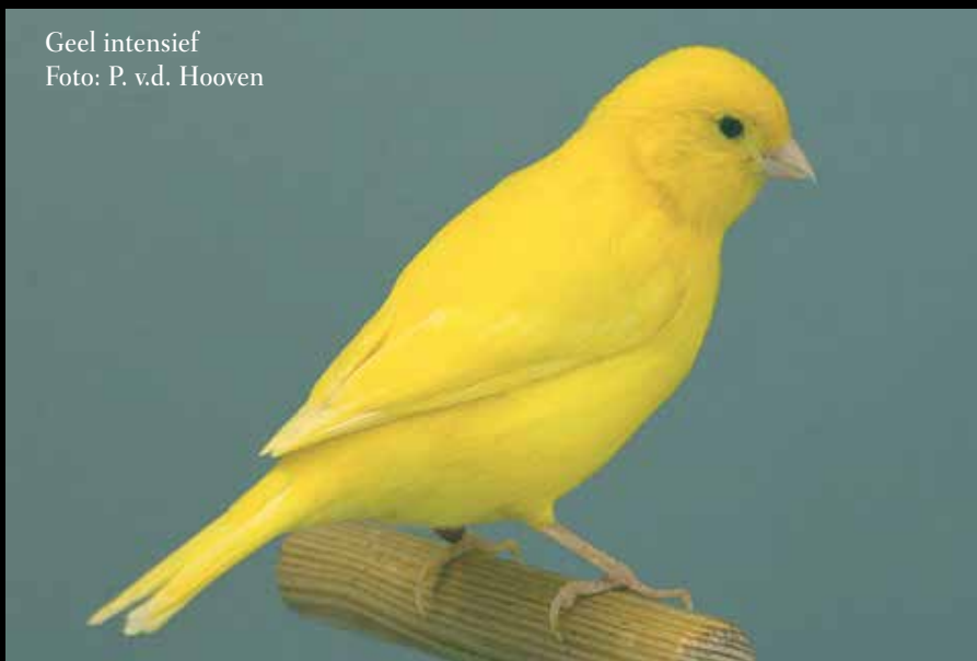
Geel intensief

En niet te vergeten de voorbereiding op de show. Zorg voor rustige vogels die bovendien 'om de punten vragen'. Een rustige vogel die zich goed presenteert zal bij de keurmeester altijd een veel betere indruk maken dan een vogel die onrustig blijft! En dat heeft zeker z'n invloed op de beoordeling in punten!