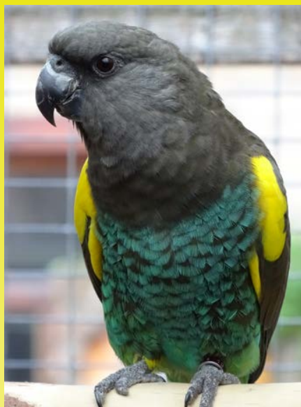
Man, vier jaar oud

Kop, nek, en borstkleur: flets grijsachtig bruin.