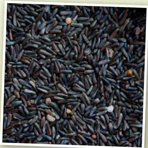
Nigerzaad. Een waardevol zaad dat in de standaardmengsels maar matig aanwezig is, vanwege zijn duurdere prijs. Het wordt door kanaries heel graag gegeten.