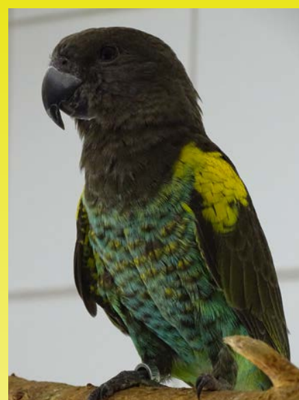
Man, 4 maanden oud

Rug en vleugeldek: warm grijsbruin, vleugeldekveren hebben een blauwgroene omzoming.