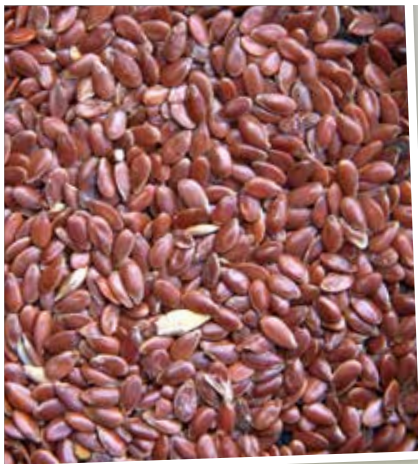
Lijnzaad: zaad van de vlasplant. Bevat hoge hoeveelheden omega-3-vetzuren. Het is slijmvormend en bevordert hierdoor de spijsvertering.