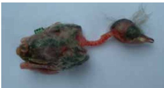
Afgekloven nek, spitsmuis aan het werk geweest

Tja, wat kan er 's nachts allemaal verkeerd gaan? Vogels kunnen schrikken van alle vreemde geluiden en bewegingen, speciaal in de nacht. Ik verloor al eens vogels door een nachtelijk vuurwerk wat door de gemeente werd aangeboden aan de lokale gilde die enkele duizenden jaren bestond geloof ik. Midden in het broedseizoen! Dit jaar was er 's nachts "iets" (uil, kat rat?), waardoor de roodborsttapuit man zijn borstveren verloor, die in een pluk aan de volièredraad hingen (enige stuk met enkelzijdig gaas, nu dubbelzijdig gemaakt, kalf, put, enz.). Met als gevolg een verschrikte vogel die dagenlang onzichtbaar bleef, waardoor het eerste legsel eitjes onbevruucht was. En de man tuinfluiter, die vond ik terug met een gebroken vleugel. Ook al einde kweekseizoen! Ook de kleine plevier (zelfde volièrre als de roodborsttapuit) was dermate geschrokken dat het vrouwtje er een gebroken vleugel aan overhield, terwijl de man op z'n kop in een bosje met biezten belandde. Daar kwam hij in vast te zitten en overleed hij. Wat een drama al zo vroeg in het kweekseizoen! En