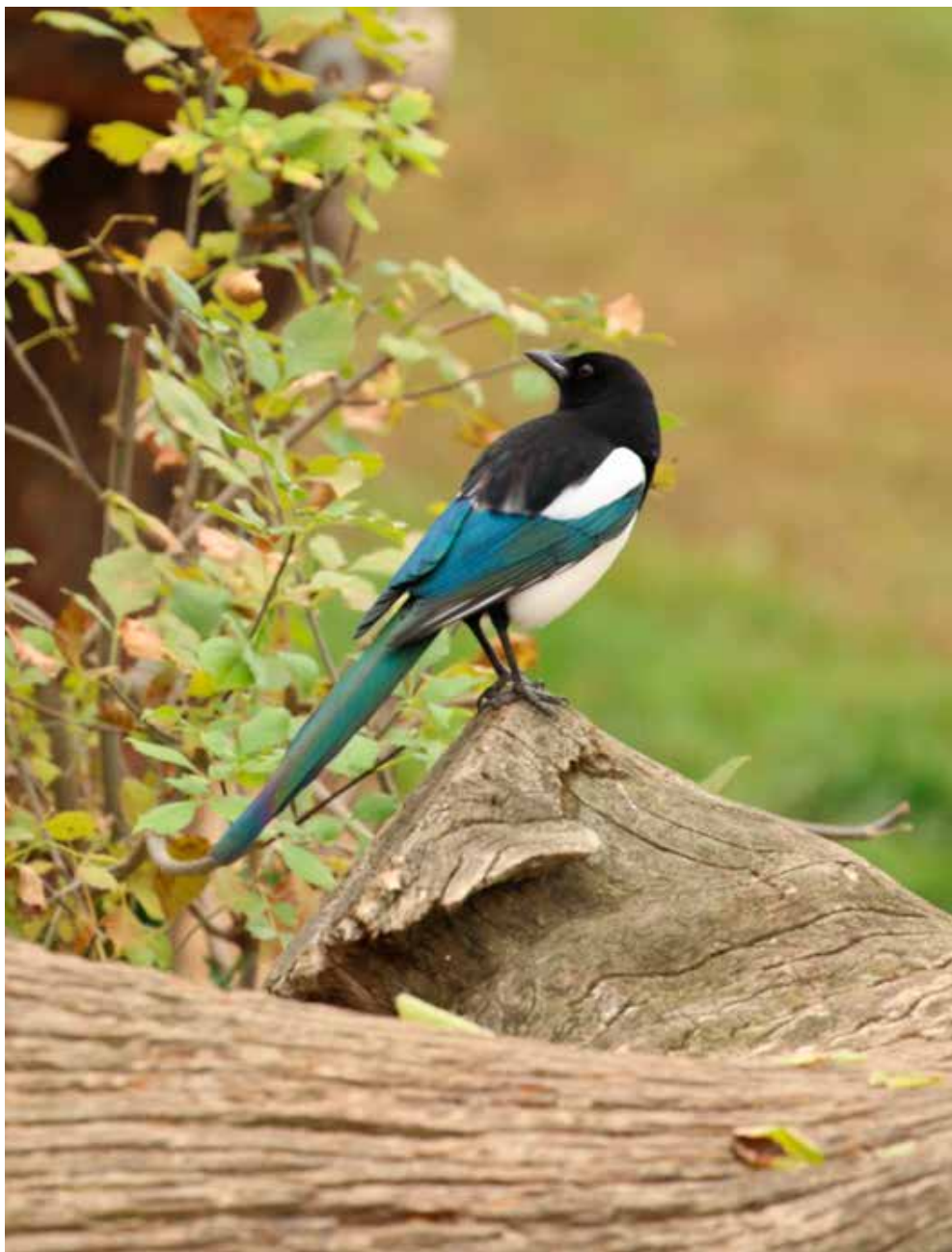
Ekster, prachtige vogel, ellendige vogelkiller...

voor al die vogels geldt dat je niet even een andere kunt kopen. Die zijn gewoon niet beschikbaar, zeker niet vroeg in het kweekseizoen.