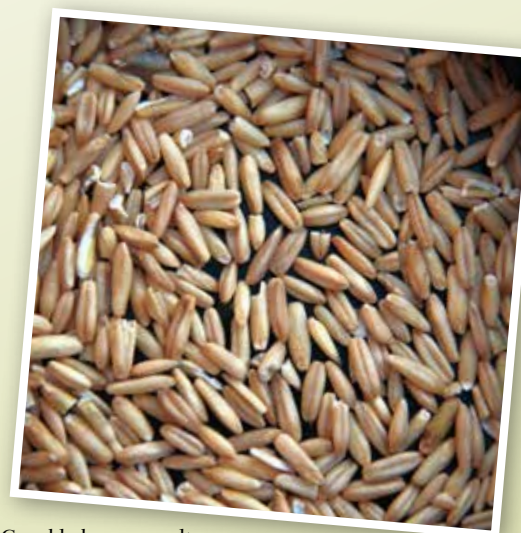
Gepelde haver: wordt graag opgenomen en aan de jongen gevoerd.

In de winter hebben kanaries behoefte aan een arme voeding met weinig eivoer. Ik geef hen twee keer per week een hoeveelheid eivoer die in korte tijd op moet zijn. Elke vogelliefhebber weet dat vogels die koud gehuisvest zijn veel meer eten dan vogels die altijd warm gehuisvest worden. Gezonde kanaries kunnen best tegen wat lagere temperaturen. We moeten ze dan ook niet vet mesten.