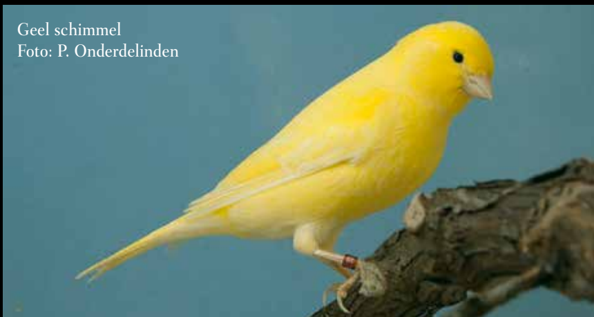
Geel schimmel