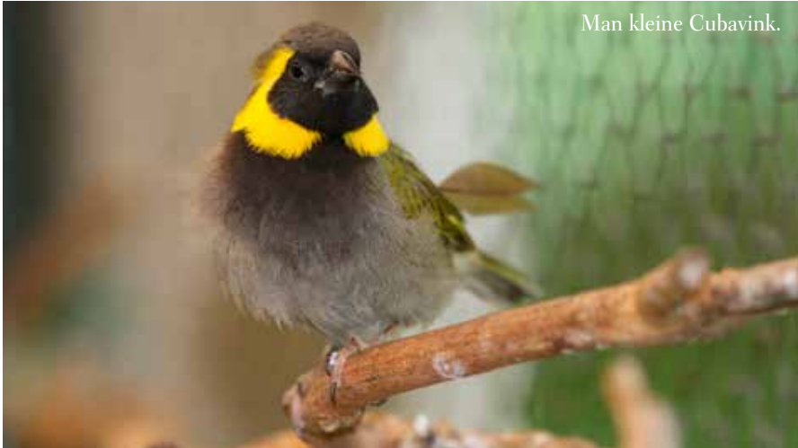
Man kleine Cubavink.