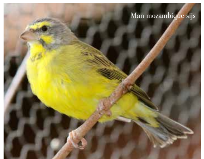
Man mozambique sijs