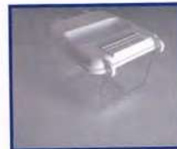
NIEUW van Fauna Badhuis multi en Nestkast variant Introductie aanbieding 11 + 1 gratis