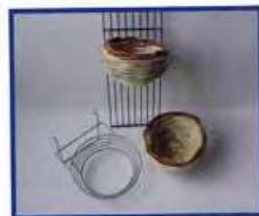
Nestring met wit sisalnest 11 cm. NU VOOR € 2,50