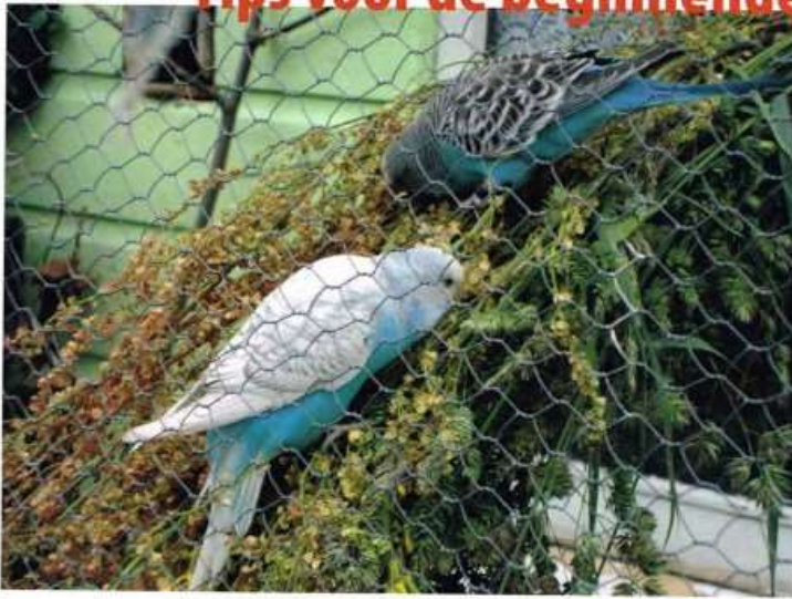
Jonge grasparkieten op bundel veldzuring en kropaar 1