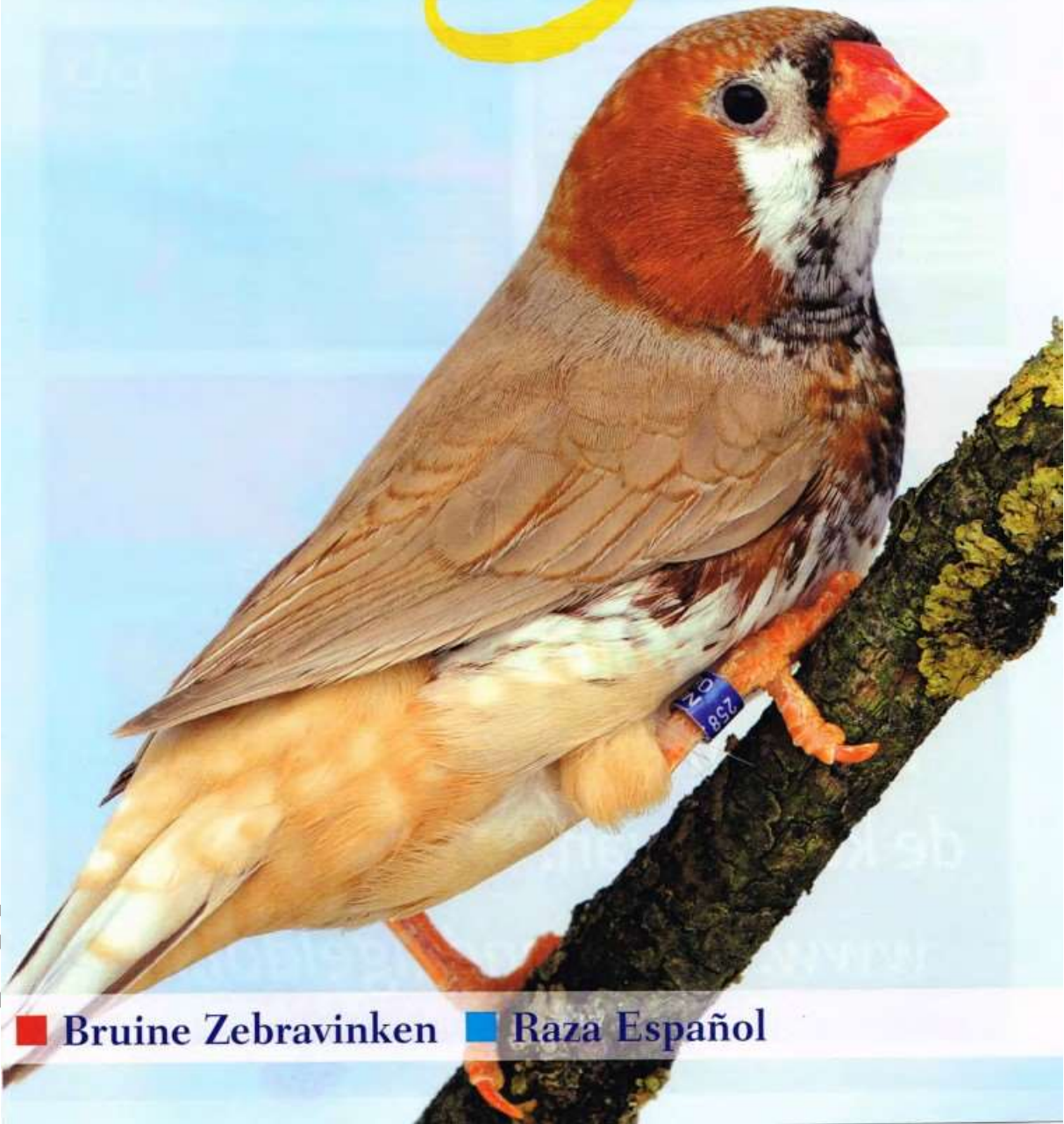
■ Bruine Zebra vinken ■ Raza Español