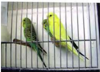
Jonge grasparakieten samen in de trainingskooi

en trosgierst. Als u ziet dat een jong zich kan redden met het pellen van de zaden dan mag u aannemen dat het zich zelf kan redden. Een ander hulpmiddel: als de beide langste staartpennen 1½ cm langer zijn dan de secundaire staartpennen, dan kan ook worden aangenomen dat het jong zelfstandig is.