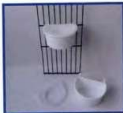
Nkb bakje met morsrand SET prijs 12 stuks voor € 4,50