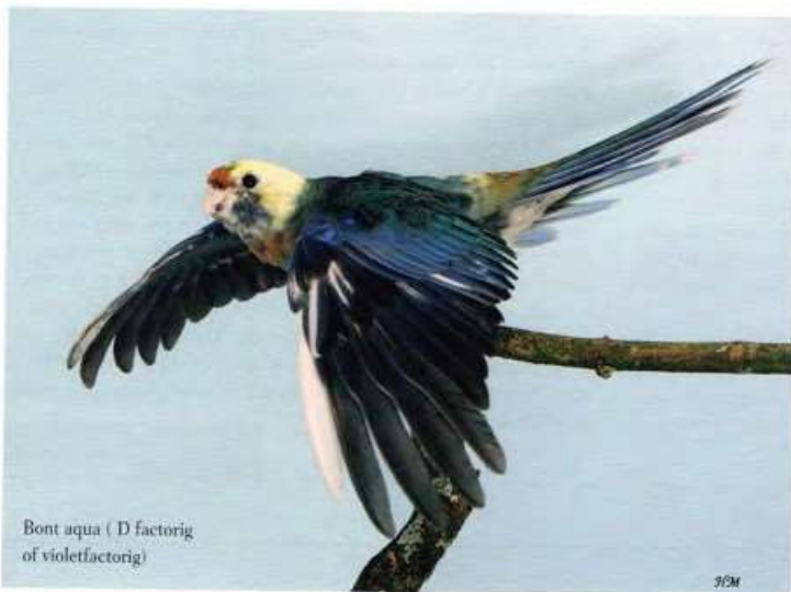
Bont aqua ( D factorig of violefactorig)