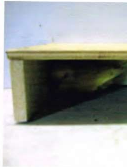
Jonge lutino's zoeken dekking onder een schapje