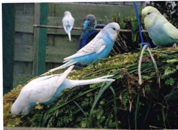
Jonge grasparakieten op bundel zuring en kropaar 2