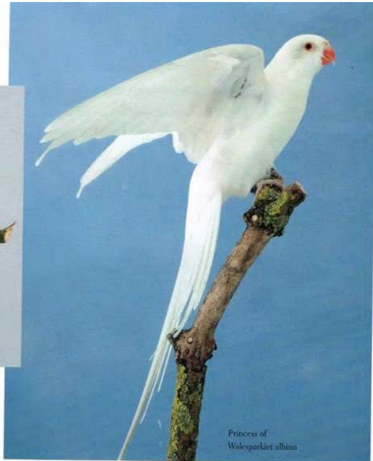
Princess of Walesparkiet albino

Mijn gezinsleden vinden mijn hobby best maar dan vooral (mede door de woonplaats) op afstand. Ondanks dat mijn vrouw geen echte vogelliefhebber is heeft ze momenteel thuis een kleine volière met vogels zodat er toch iets zit te fluiten in de tuin. Mijn liefhebberij vindt ze wel erg aan de ruime kant.