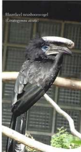
Blauwkeel neushoornvogel ( Ceratogymna atrata )