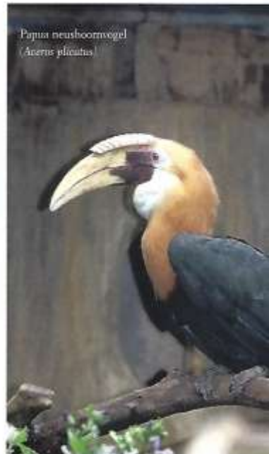
Papua neushoornvogel ( Aceris plicatus )

en daarom tijd nodig om te herstellen van haar isolatie. Bij andere soorten verlaat de moeder het nest al vóórdat de jongen zelfstandig zijn en blijft ze daarna uiteraard samen met het mannetje voeren.