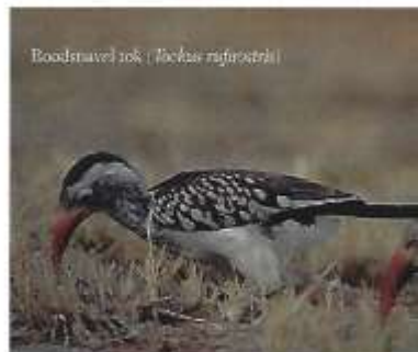
Boodsnavel tok ( Chalcus rufirostris )

Een tweede kenmerk van neushoornvogels is de gigantisch grote snavel. Men vermoedt dat deze constructie de roep van de vogels in het oerwoud versterkt waardoor ze beter met elkaar kunnen communiceren. Ook wordt de snavel wel als wapen gebruikt in de strijd tussen liefdesrivalen. <