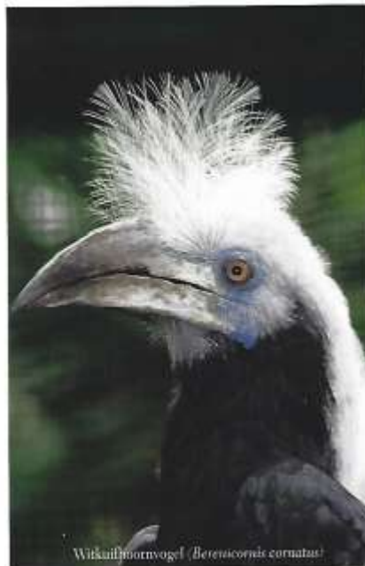
Witkruinhornvogel ( Berenicornis cornatus )