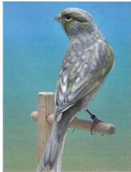
Zwart pastel grijsvleugel geel mozaïek, type 2

De toppen van de slag- en staartpennen moeten donker zijn, terwijl de rest van de veer sterk opbleekt en grijs wordt. Hier zitten we al met het eerste probleem.