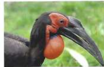
Zuidelijke hoornraaf ( Bucorvus leadbeateri )