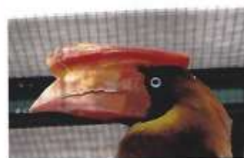
Roodbruin neushoornvogel ( Buceros hydrocorax )