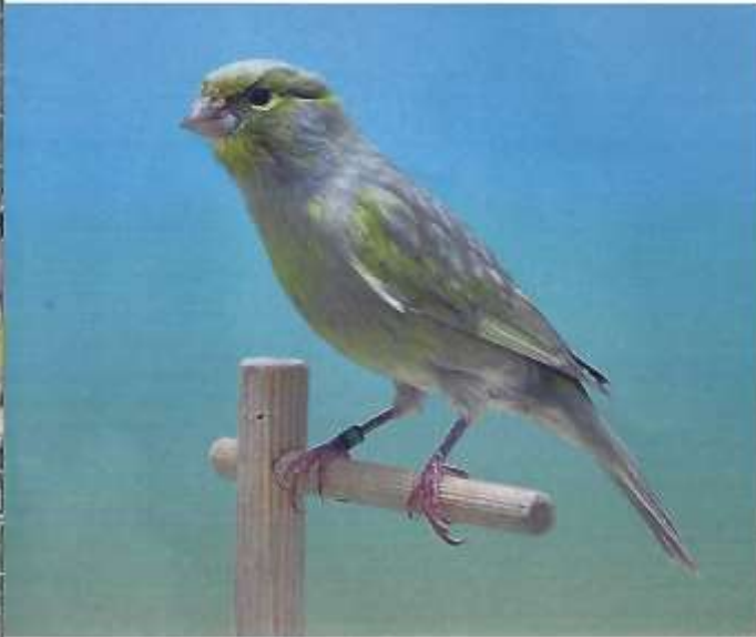
Zwart pastel grijsvleugel geel mozaïek, type 2