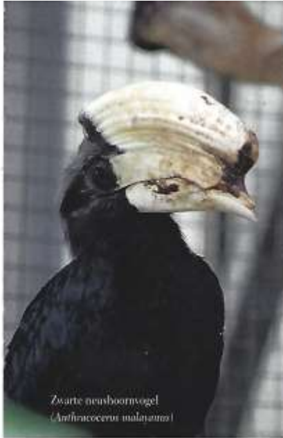
Zwarte neushoornvogel ( Anthracoceros malayanus )