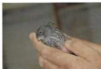
Zwart geel mozaïek type 1