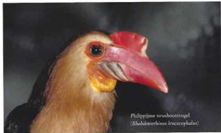
Philippijnse neushoornvogel ( Rhinoceros leuccephalus )