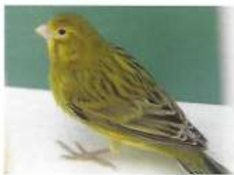
Agaat geel intensief