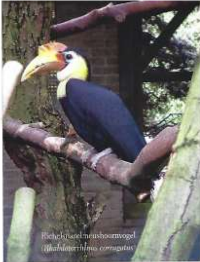
Rhynchotus neushoornvogel ( Rhinoceros bitorquatus )