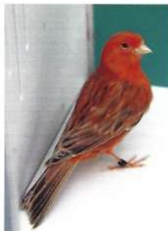
Agaat topaas rood intensief

Je kunt beweren wat je wil, maar in de kleurkanariewereld zijn er altijd ontwikkelingen gaande. Er wordt gefokt volgens de standaard of net niet. Door middel van selectie ontstaan 'nieuwe kleuren' zoals je de mogno zou mogen noemen. Dergelijke vogels wijken sterk af van de standaard. Zo sterk dat er keuzes gemaakt moeten worden door de keurmeesterwereld. Dergelijke ontwikkelingen bij de liefhebbers worden doorgaans gevolgd door wijzigingen in de standaard. Of het aanmaken van een nieuwe standaard zoals bij de mogno het geval was. De laatste jaren zien we dat verschillende kleurslagen, door het steeds donkerder kweken van het pigment, steeds meer op elkaar gaan lijken. Zo wordt het steeds moeilijker om bijvoorbeeld een eumo en een topaas van elkaar te onderscheiden. En ook de steeds donkerder wordende agaastpastellen worden moeilijker te herkennen. De pootkleur een topaas was vroeger wat lichter (en ook zo in de standaard vernoemd), maar door het fokken van steeds donkerder pigment