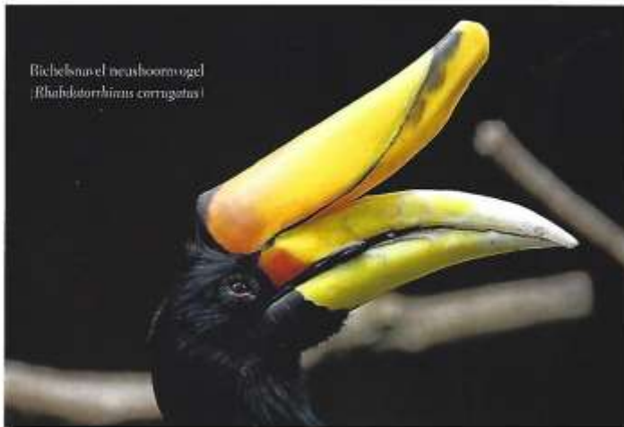
Riebel'snevel neushoornvogel ( Rhabdotorrhinus corrugatus )