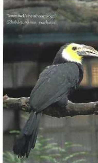
Temminck's neushoornvogel ( Rhabdotorrhinus everhartsii )