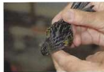
Zwart geel mozaïek type 2

door. Dergelijke donkerder opalen kregen de punten, zeker wanneer een en ander gecombineerd wordt met een heldere grondkleur. Hier worden keurmeesters en liefhebbers 'terug gefloten'. Een donkerder opaal met een mooi helder rugdek is een plaatje, maar..... hij mag niet te donker worden. Dat zijn dan vogels die richting mogno gaan. En dat is perse niet de bedoeling. De typisch 'blauwe schijn' van een opaal moet zichtbaar blijven. Zo golft een en ander op en neer. Soms schiet de liefhebber door en dan moet de Technische Commissie ingrijpen.