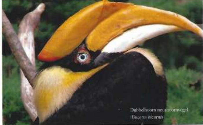
Dubbelhoorn neushoornvogel ( Buceros bicornis )