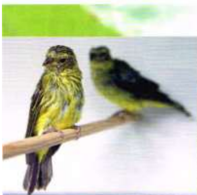
De jongen worden behandeld, geplukt door de ouders.

Natuurlijk is niet ieder contact onder de leden een succes. Maar vaak is het een zaak van "wat je zelf investeert in een contact komt vaak ook terug". We hebben willen laten zien dat het een heel gedoe is om een bepaalde soort te pakken te krijgen, maar met de juiste instelling en met de juiste contacten is er veel mogelijk. Het verhaal over deze vogels zou niet mogelijk zijn geweest zonder een goed contact met andere liefhebbers. Dat contact begint vaak bij een eerste kennismaking via Serinus-Society en kan alleen worden uitgebreid en onderhouden door zelf te investeren in de contacten met de andere liefhebbers. Dit maakt het dus gewoon mogelijk om soms tot dit soort successen te komen. Er wordt wel eens gezegd dat de "Vogelsport" een ingeslapen liefhebberij is die langzaam zal ophouden te bestaan. Wij van Serinus-Society denken dat "Vogeliefhebberij" een bloeiende hobby is, met veel kansen, uitdagingen en mogelijkheden! Maar dan moeten die kansen, uitdagingen en mogelijkheden wel worden gezien, benut en gekoesterd. <