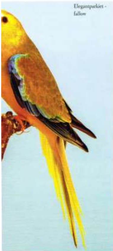
Elegantparkiet - fallow