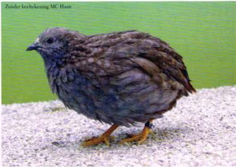
Zonder keeltkening MC-Haan

Ook de bruin mutatie is in de standaard verwerkt. Deze mutatie zal in de toekomst bij het verschijnen als kleurmutatie worden ingedeeld. Het beschrijven in deze standaard is gedaan omdat met aan zekerheid grenzende waarschijnlijkheid de bruin mutatie zal ontstaan en dan ook direct duidelijk herkenbaar zal zijn.