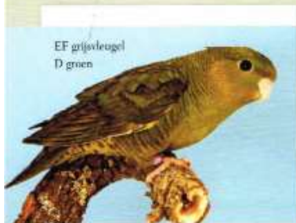
EF grijsvleugel D groen

vlak over gemaakt zijn. De omschrijving van de kleurslag verandert niet wel de naamgeving. Dus in het vraagprogramma, de standardeisen en boven het keurbriefje treft men voortaan SL-Ino aan.