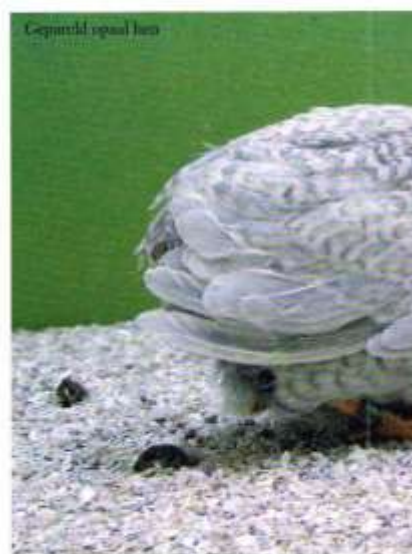
Gepareld opaal hoo