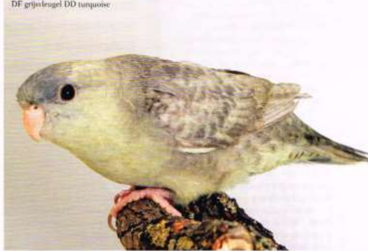
DF grijsvleugel DD turquoise

Liefhebbers en keurmeester kunnen de standaardeisen lezen en downloaden via de N.B.v.V website: http://nbv.nl/download/standaardeisen/Catharinaparkieten.pdf . De aanpassingen en wijzigingen die zijn doorgevoerd ten opzichte van de standaardeisen Catharina parkiet 2011 zijn voorzien van een rode