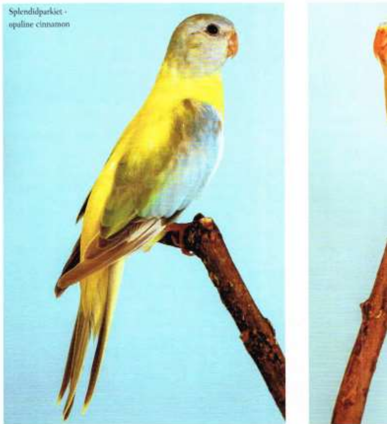
Splendidparkiet - opaline cinnamon

Bij de Turquoise parkiet zijn keurtechnische aandachtspunten voor Dilute kleurslagen uitgebreid vermeld. Ook zijn de kleurslagen D groen, DD groen en Violet toegevoegd.