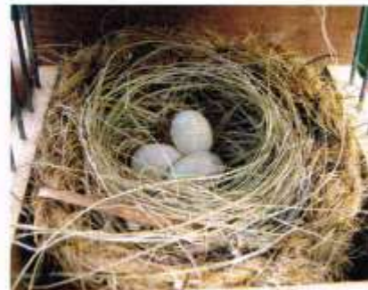
Grote foto: Maskercini pop Foto boven: Met voornamelijk cocos werd een mooi nest gebouwd

die veelvuldig hun kostje op de bodem bij elkaar scharrelen. De indruk bestaat dat het biotoop van Maskercini's meer in de hoesjes/bomen ligt, ook wordt er opvallend weinig gebaad.