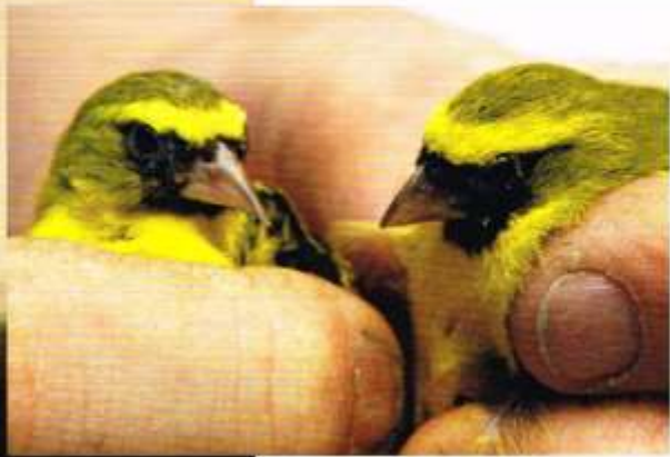
Grote foto: Maskereini man