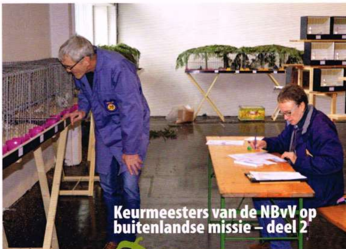
Keurmeesters van de NBvV op buitenlandse missie – deel 2