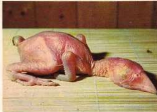
12 dagen oud