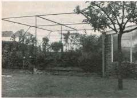
Een algemeen beeld van de begroeiing in de buitenvolière

Een buitenvolière mag niet te klein en vooral niet te laag zijn. Men biedt elke vogel liefst zoveel mogelijk m 3 aan, waarbij de minimum-