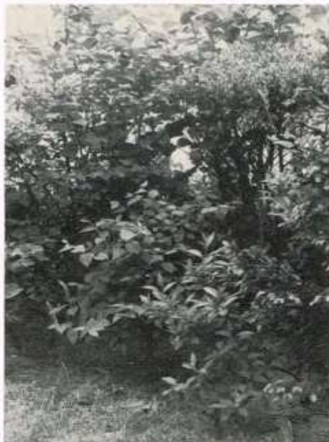
Een beeld van een dichtbegroeide hoek van de buitenvolière

Een dakbedekking van nylonnetten, biedt geen weerstand aan knaagdieren, maar een stevig soort nylonvlechtwerk is wel bestand tegen katten en roofvogels. Een dergelijke volièrèbedekking kan men 's winters verwijderen, waardoor de noodzaak van een stevige dakkonstruktie om het instorten van de volièrè bij hevige sneeuwval tegen te gaan, wegvalt. Alhoewel een dergelijke konstruktie, afhanke-