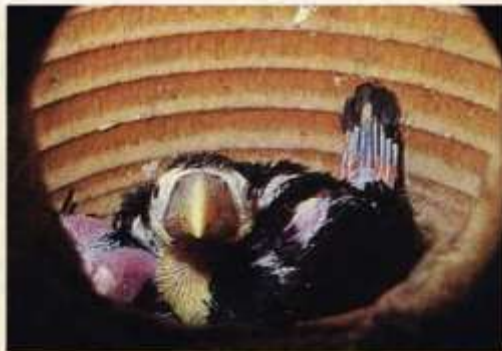
34 dagen oud