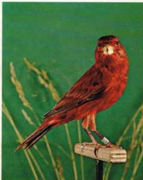
Oranje Rood Brons

standers over het verven van binnen uit, het motief van de tegenstanders was steeds „Ze maken rood wat ze willen“. Dat motief gaat NIET op bij het gebruik van Betacarotine, we kunnen weer eerlijk zijn tegenover onszelf en onze liefhebberij! Een ieder kan voor zich uitmaken welk stimulerend middel (er zijn er nogal wat) hij wenst te gebruiken, maar ik hoop dat bovenstaande argumenten veel liefhebbers er toe doet besluiten over te gaan op het gebruik van Betacarotine. De vragen door Dhr. Wolthof gesteld wij ik, met de ervaring door mij opgedaan bij het gebruik van Betacarotine, beantwoorden.