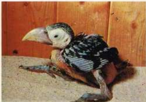
27 dagen oud