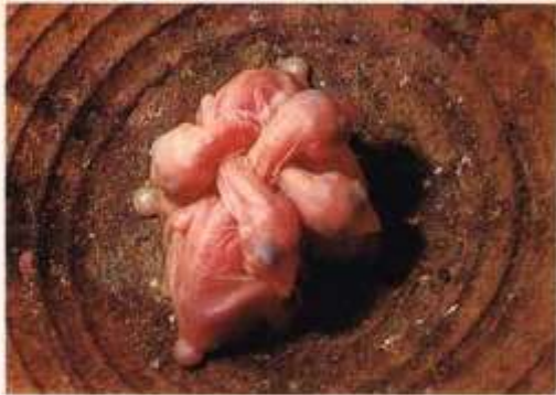
5 dagen oud