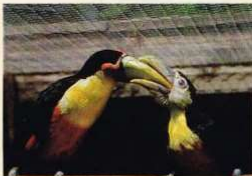
Juist uitgevlogen jong