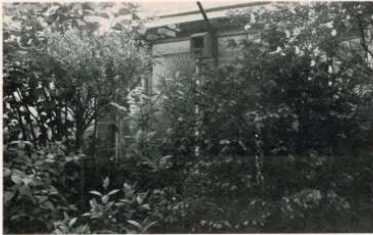
Een nestkastje tussen de begroeiing tegen de binnenvolière opgehangen.

kan men toch beter bovenop en achteraan een bescherming aanbrengen, zodat de tangara's niet steeds in elk weertje moeten buiten zitten. Gegolfde plasticplaten en rietmatten zijn daarvoor geschikt, maar ze moeten wel stevig aan de volièrekonstruktie worden vastgemaakt, zodat ze aan een stormweer kunnen weerstaan. Ook de pas uitgevlogen jongen zullen er misschien gebruik van maken, alhoewel ze langdurig regenweer best verdragen, als ze maar een dichte begroeiing ter beschikking hebben.