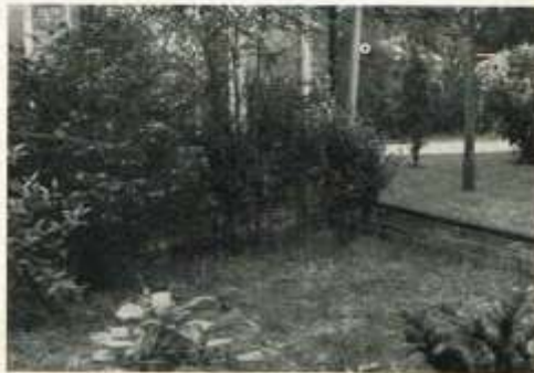
De randbegroeiing van een open plek vooraan in de buitenvolière

Naast de overblijvende beplanting, kan men ook allerlei eenjarige en overblijvende bloemen in de volière planten. Vooral vroegbloeiende bolgewassen (krokussen en tulpen bv.) geven goede resultaten. Hun bloemen verschijnen nog voor de beplanting dicht bebladerd is, wat een fris lente-achtig effect geeft. Bovendien vormen de droge krokusbladeren later een uitstekend nestmateriaal. De beginnende lente is ook een gevaarlijke