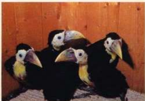
41 dagen oud