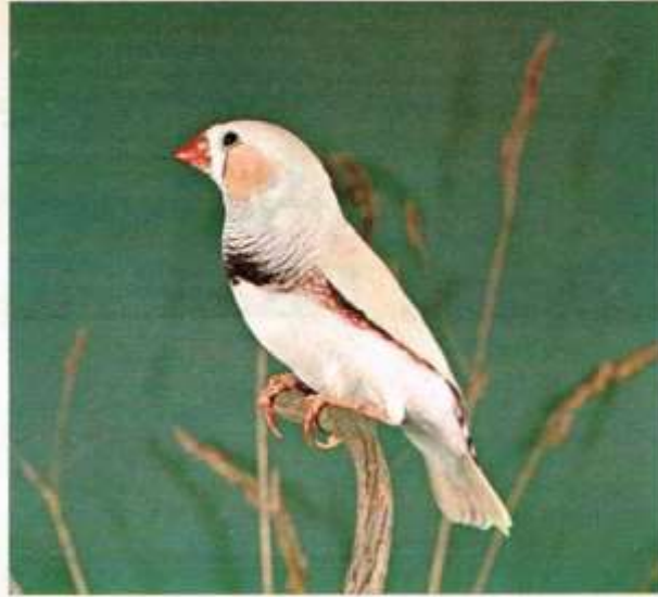
Is op pag. 100 abusievelijk genoemd dom, crème, doch is zwartmasker!

We krijgen nu een zebra-vink voor ogen die ook weer volgens de advertenties in Onze Vogels regelmatig wordt aangeboden, nl. de isabel. Maak u echter nog niet te blij, de aangeboden vogels blijken in alle gevallen gewone normaal bruine te zijn, in vele gevallen zelfs bruine vogels die te licht van kleur zijn (goed voor de crémekweek), maar niet geschikt voor de T.T. en in het geheel geen isabellen. Over de isabel kunnen we kort zijn, dit is eigenlijk een crèmevogel zonder tekening. De man heeft dus dezelfde verschijningsvorm als de bruinvleugelmaan, het totaal