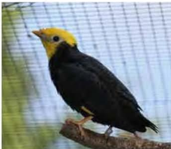
EK 1992, Goudkop beo