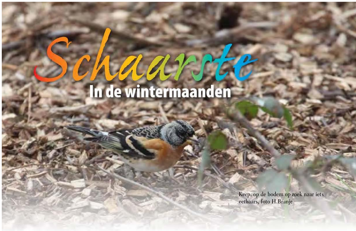
Keep, op de bodem op zoek naar iets eetbaars

Naar aanleiding van het artikel in Onze Vogels "Hoe houden vogels zich warm?" vond ik dat ik moest reageren met mijn onderzoekje over schaarste in de wintermaanden.