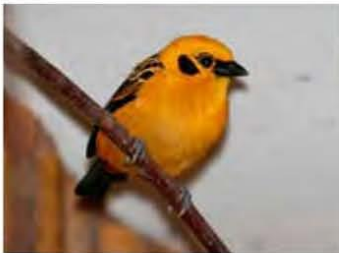
EK 2004, goudtangara