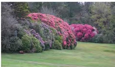
Veel bloeiende bomen en struiken