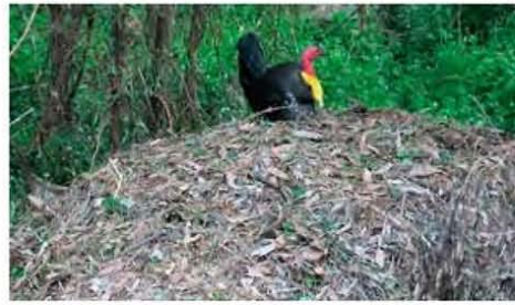
Boskalkoen boven op z'n nest