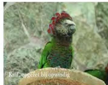
Knif, opgezet bij opwindig