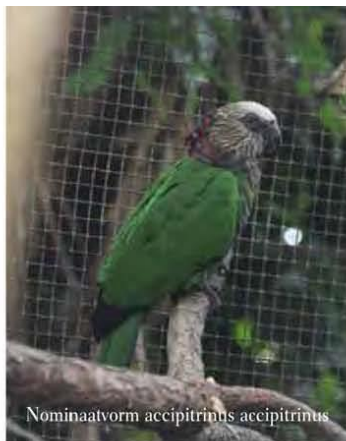
Nominaatvorm accipitrinus accipitrinus

Kraagparkieten baden graag, daarom zorgen dat er steeds fris badwater aan-