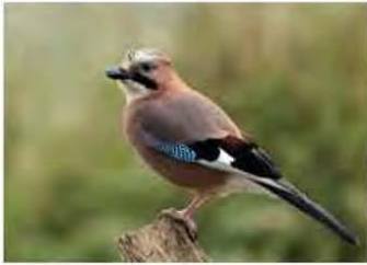
Vlaamse gaai, gespecialiseerd in eikels, foto H.Branje

ste verder toe. Daarnaast zijn gevallen boomzaden ook niet direct en alleen voor vogelconsumptie geschikt. Er zijn een vijftal opties dat een kleine vogel een boomzaad zoals een eikel ook werkelijk eet :