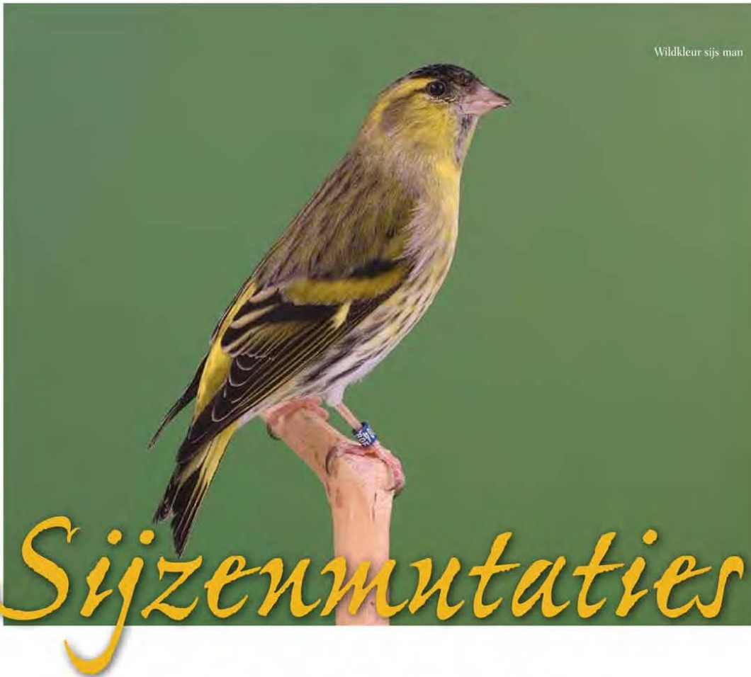
Wildkleur sijs man