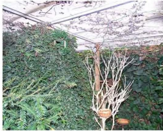
Veel groen in volière