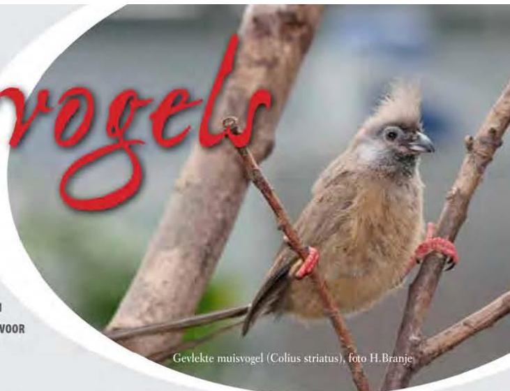
Gevlekte muisvogel ( Colius striatus )

Alle zes soorten komen alleen maar voor in Afrika, ten zuiden van de Sahara. Muisvogels zijn zo'n 30-36 cm lang (inclusief staart) en hebben een klein opgericht kuifje. Typisch bij de familieleden van de muisvogels is dat alle vier tenen naar voren wijzen! De buitenste tenen kunnen ze naar allerlei kanten bewegen. Door deze typische tenen kunnen ze zonder problemen ondersteboven hangen terwijl ze zich tegoed doen aan vruchten. Ook kunnen ze met hun potjes heel goed voedsel vasthouden en zich op de vreemdste manieren ergens aan vast houden.