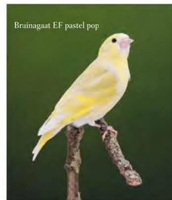
Bruinagaat EF pastel pop