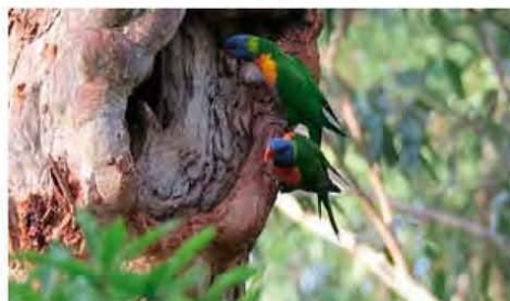
Lori's van de Blauwe Bergen

rotsformatie van The Tree Sisters. Er gaan verschillende legendes rond maar wij bekijken dit toch als een prachtig in vorm gewaaid en versteend stuk natuur. Het is 10 graden en er waait een harde wind, tijd om terug te gaan naar de auto waar de verwarming aan staat. Voor twee nachten hebben we een camping geboekt in Blackhead. Wanneer we de camping verlaten komen we in een memorial parkje, een weelderige tuin van azalea's, rododendrons en vele andere bloeiende bomen en struiken. Het voorjaar laat zich van zijn mooiste kant zien. De volgende morgen in de schemer loop ik langs het riviertje naast de camping en zie de Pennantparkieten die elkaar voeren en meteen erna paren. De waaierstaartvogels volgen mij langs het grasveld waar Woodduckseenden lopen te snateren in het nog natte gras.