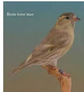
Bruin ivoor man

selectie op goede broedeigenschappen zijn het vandaag de dag zeer betrouwbare Europese cultuurvogels geworden. Nog een groot voordeel is dat de sijs een vogel is voor puur natuurbroed. En misschien nog het grootste voordeel is dat men de sijs, als men ze huisvest in een ruime broedkooi of volière met een kurkdroge en zuivere bodem, medicatievrij kan houden. Het duidelijk geslachtsdimorfisme tussen man en pop speelt ook in hun voordeel. Iets dat bij putters en barsijsen voor verrassingen kan zorgen. Dat een vogelsoort als de sijs waar zo goed mee gekweekt wordt,