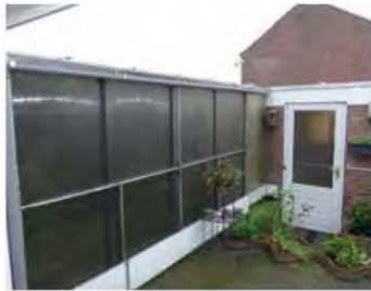
Volièrres, gezien van buiten

Ondergetekende denkt dat de huisvesting van de vogels heel goed te noemen is. De volièrres zijn van boven geheel overdekt met kunststof platen; driekwart van de volièrres is ingenomen door groen in de vorm van klimop, wilde wingerd, taxus en hibiscus. Het groen groeit dusdanig hard dat in september flink gesnoeid moet worden; maar ook af en toe wanneer bijvoorbeeld de zitstokken te veel overwoekerd worden. Overigens helpen sommige soorten ook met snoeien. Zo zijn de grijswangisibias dol op bladeren en ook op bloemen, want de hibiscusbloemen worden allemaal netjes opgegeten... Watervoorziening van de vogels geschiedt met behulp van een watervalletje met stromend water. In de volièrres is onderlangs een kunststof slang met kleine een zestal sproeiers (50 cm waterstraal) aangebracht die aan de voorkant van de volièrre aangesloten is op de waterleiding. In de zomer wordt minstens één of tweemaal per week gespreoid zodat de planten volop water krijgen om weelderig te kunnen groeien. De volièrres zijn niet voorzien van een nachthok. Wel kunnen de volièrres, die beschut staan tussen een dichte achtermuur, een vogelverblijf en een dichte wand, ook nog aan de voorkant afgeschermd worden met dubbelwandige kunststof platen. De vogels die gehou-