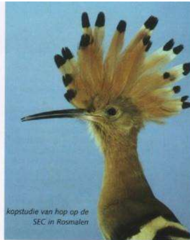
kapstudie van hop op de SEC in Rosmalen

Op 17 mei werd het eerste jong geboren, op 18 mei jong twee en drie en op 19 mei jong vier en vijf. Het zesde ei kwam niet uit. Het ouderkoppel bestond uit vogels van ongeveer een jaar oud en dat kan soms nog wel eens problemen opleveren vanwege de jonge leeftijd. Het voeren van de jongen ging niet geweldig en zo had ik op 21 mei nog drie jongen over. Dit voeren gebeurde als volgt. Ze kregen meelwormen, moriowormen, wasmotten en krekels tot hun beschikking. De man neemt voedsel op, brengt dit naar het blok en geeft het door het invlieggat aan de pop. De pop geeft dit vervolgens weer aan de jongen. Ik heb de man nooit in het broedblok gezien. Als ik op drieëntwintig mei de jongen wil ringen, zie ik dat er nog twee over zijn. Deze heb ik geringd met de