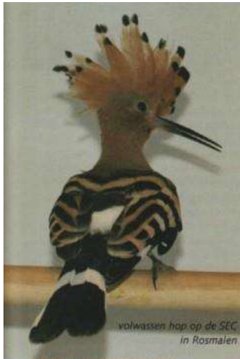
volwassen hop op de SEC in Rosmalen