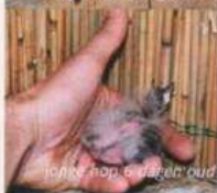
jonge hop 6 dagen oud