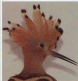
Bijzondere kweek met de hop 66

Het volgende nummer wordt ter post bezorgd op 20 maart 2006