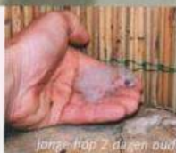
jonge hop 2 dagen oud