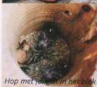
Hop met jongen in het blok